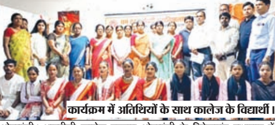
कार्यक्रम में अतिथियों के साथ कालेज के विद्यार्थी।