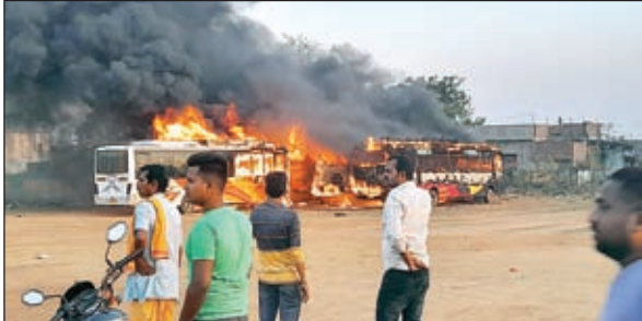
धु-धुकर जलती बसें व मूकदर्शक लोग

दुमका। जिले के बासुकीनाथ स्थित बस स्टैंड के पीछे खाली मैदान में खड़ी पांच बसें शनिवार को जलकर खाक हो गईं। बताया गया कि शाम 5 बजे के करीब मैदान में खड़ी कोच से धुएँ के बड़े-बड़े गुब्बारे के साथ आग की बड़ी-बड़ी लपटें उठते देखी गईं। आग का तांडव इस कदर था कि कुछ क्षण