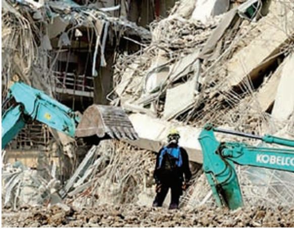
म्यांमार में भूकंप से जमींदोज घर का मलबा हटाते जवान ।

बात की है और अमेरिका की ओर से जल्द सहायता पहुंचाने की बात कही है।