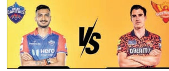
हेड टू हेड रिर्कोर्ड

एजेंसी विशाखापत्तनम। दिल्ली कैपिटल्स आईपीएल 2025 के अपने दूसरे मुकाबले में रविवार को सनराइजर्स हैदराबाद का सामना करेगी। 2020 सीजन की उपविजेता दिल्ली ने अपने अभियान की शानदार शुरुआत की थी और लखनऊ सुपर जायंट्स के खिलाफ रोमांचक मुकाबले में जीत दर्ज की थी। दिल्ली के लिए उस मैच में आशुतोष शर्मा ने शानदार प्रदर्शन किया था। अब उसका सामना काफी मजबूत टीम से है। हालांकि, सनराइजर्स को