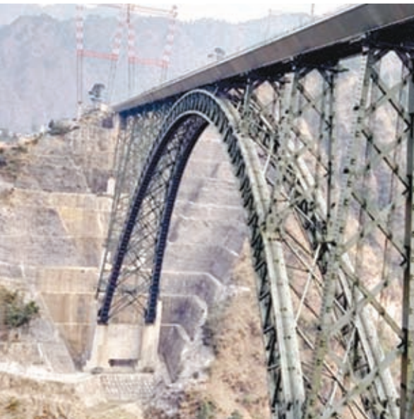
मोदी जल्द इस रेल सेवा को हरी झंडी दिखाएंगे, जिससे कटरा से

यह परियोजना हिमालय के कठिन भौगोलिक परिस्थितियों में बनाई गई भारत की सबसे चुनौतीपूर्ण रेलवे परियोजनाओं में से एक है। इसमें 119 किमी के ट्रैक पर 38 सुरंगें और 931 पुल शामिल हैं। दुनिया का सबसे ऊंचा रेलवे पुल-चिनाब ब्रिज (359 मीटर ऊंचा) और भारत का पहला केबल-आधारित रेल पुल-अंजी ब्रिज भी इस प्रोजेक्ट का हिस्सा हैं। प्रधानमंत्री नरेंद्र