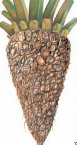
साभार : कार्टून म्यूवमेंट