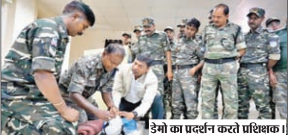
डेमो का प्रदर्शन करते प्रशिक्षक।