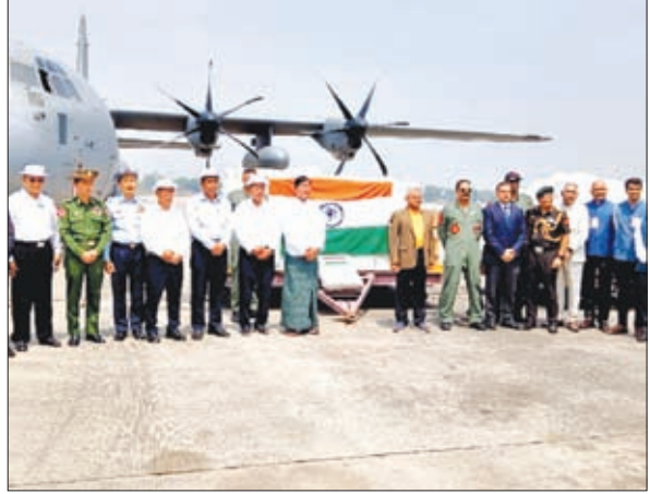
15 टन राहत सामग्री लेकर यांगून पहुंचा भारतीय विमान ।