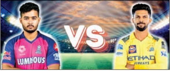
राजस्थान के पास गेंदबाजों की कमी

गुवाहाटी। राजस्थान रॉयल्स की टीम रविवार को जब गुवाहाटी के मैदान पर उतरेगी तो उसे अपनी पहली जीत की तलाश होगी। यहां उसका सामना चेन्नई सुपर किंग्स से होगा। वहीं, ऋतुराज गायकवाड़ के नेतृत्व में सीएसके जीत की पट्टी पर लौटने की कोशिश करेगी। चेन्नई के पूर्व कप्तान महेंद्र सिंह धोनी आठवें या नौवें नंबर पर बल्लेबाजी के लिए उतर रहे हैं। आरसीबी के खिलाफ मुकाबले में उन्होंने 16 गेंदों में 30 रनों की नाबाद पारी खेली लेकिन टीम को जीत नहीं दिला सके।