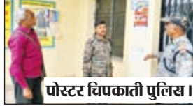
पोस्टर चिपकाती पुलिस।