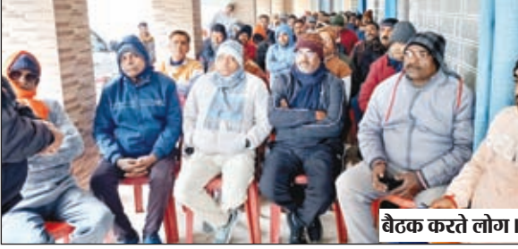
बैठक करते लोग।