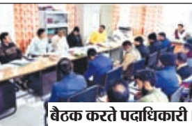
बैठक करते पदाधिकारी।

लातेहार। नगर पंचायत के सभाभार भवन में विभिन्न प्रकार के योजनाओं के चयन एवं कार्यान्वयन हेतु बैठक का आयोजन किया गया। बैठक के द्वारा पीसीसी पथ का निर्माण, सफाई वाहन की मरम्ती सहित कई योजनाओं की स्वीकृति दी गई। उक्त बैठक में सांसद एवं विधायक प्रतिनिधि, प्रशासक नगर पंचायत लातेहार एवं विभिन्न विभागों भवन प्रमंडल, परिवहन विभाग पंचयत एवं स्वच्छता प्रमंडल लातेहार इत्यादि के पदाधिकारी उपस्थित थे।