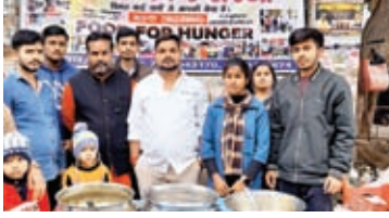
वितरण करते संस्था के सदस्य