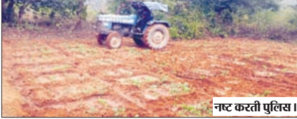
नाष्ट करती पुलिस।