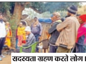
सदस्यता ग्रहण करते लोग।