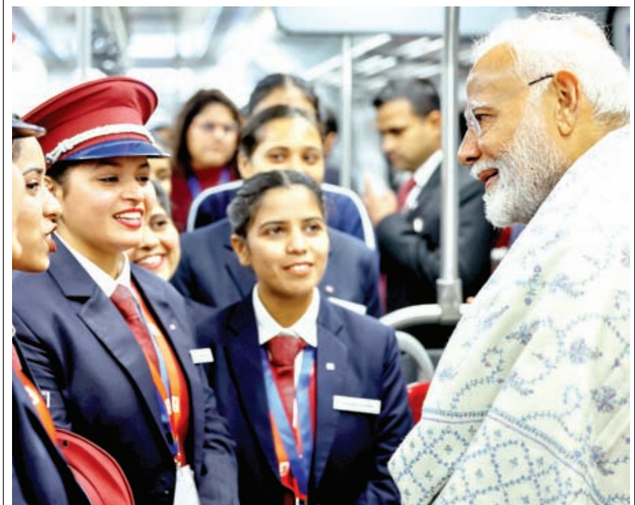
प्रधानमंत्री ने नमो भारत कॉरिडोर का किया उद्घाटन

इस्लामाबाद। तालिबान के साथ लगातार तनाव के बाद अब पाकिस्तान ने अफगानिस्तान को लेकर एकदम नए प्लान पर काम कर रहा है। पाकिस्तानी सेना अफगानिस्तान के अंदर एक बार फिर से नए गृहयुद्ध शुरू कराने की तैयारी में जुटी है। हाल ही में पाकिस्तानी सेना की शक्तिशाली खुफिया एजेंसी आईएसआई के चीफ असीम मलिक ने ताजिकिस्तान दौरे के बाद ये चर्चा तेज हो गई है। मलिक ने ताजिकिस्तान के राष्ट्रपति से मुलाकात की। यहां ये ध्यान रखना जरूरी है कि ताजिकिस्तान के राष्ट्रपति तालिबान की वापसी का खुलकर विरोध किया था। पाकिस्तान आईएसआई चीफ की यात्रा के बारे में दावा किया जा रहा है कि इसका उद्देश्य में ताजिकिस्तान में बैठे तालिबान विरोधी अफगान नेताओं से संपर्क बढ़ाना था। पाकिस्तान तेजी से ईरान, ताजिकिस्तान, यूरोप में तालिबान विरोधी नेताओं के साथ संपर्क स्थापित कर रहा है।