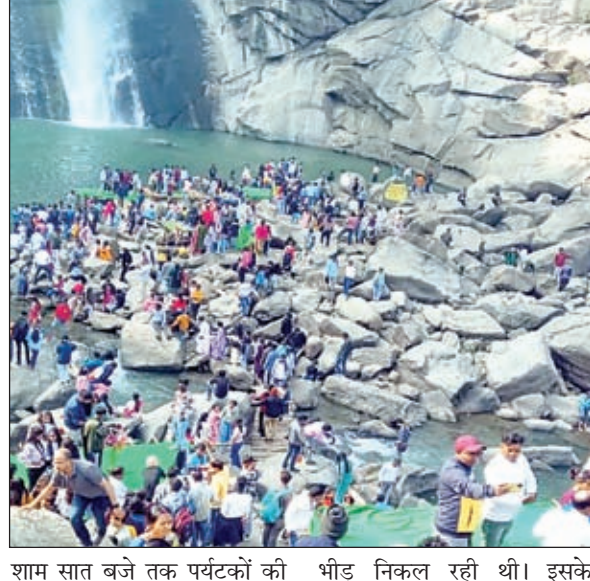
शाम सात बजे तक पर्यटकों की भीड़ निकल रही थी। इसके

सिकिंदरी। नव वर्ष के पहले रविवार को प्रखंड के हुंडरू, जोन्हा और सीता फॉल में एक जनवरी से दोगुने पर्यटक घूमने व पिकनिक मनाने पहुंचे। झारखंड समेत पश्चिम बंगाल, बिहार, उड़ीसा व छत्तीसगढ़ से पर्यटक यहां पिकनिक मनाने और घूमने पहुंचे थे। पार्किंग में जगह कम पड़ गई थी। हुंडरू फॉल पुल में वाहनों का लम्बा जाम लग गया था। चैर रखने की जगह तक नहीं थी। हुंडरू फॉल में मुख्य द्वार से हुंडरू-अनगड़ा मार्ग में करीब डेढ़ किलोमीटर पहले हुंडरू बस्ती से ही वाहनों की लंबी कतार सड़क के दोनों लगे गई थी। भीड़ इतनी थी की