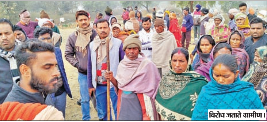
विरोध जताते ग्रामीण।