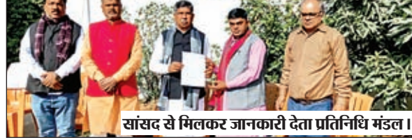
सांसद से मिलकर जानकारी देता प्रतिनिधि मंडल।