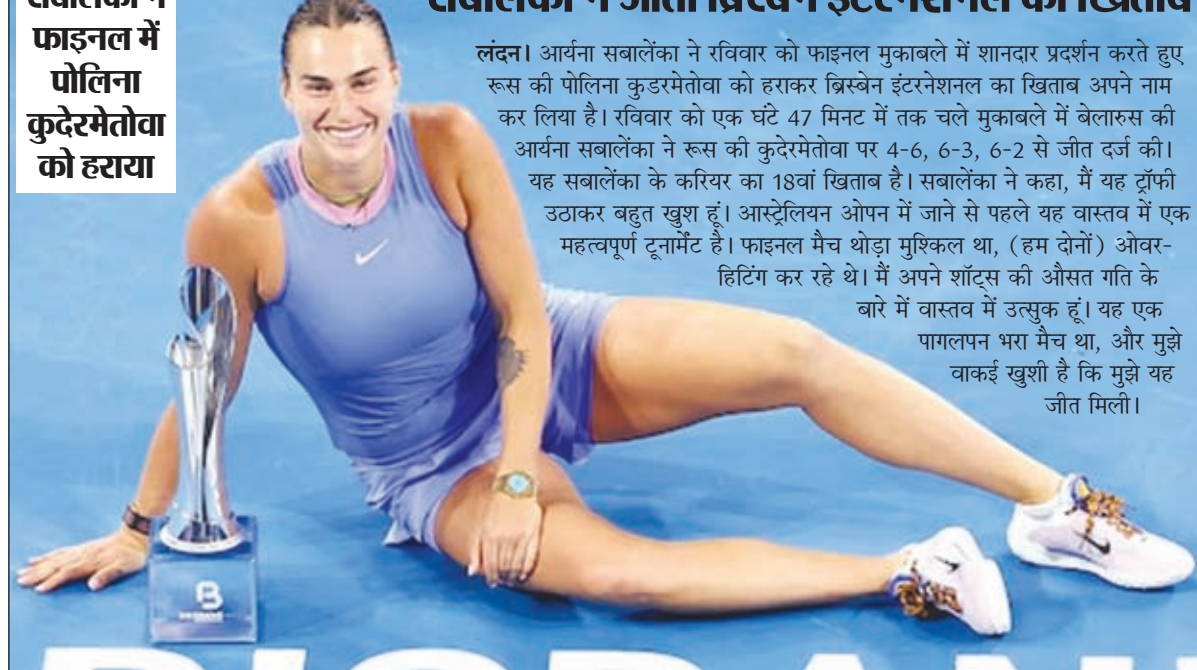
सबालेंका ने फाइनल में पोलिना कुदेरमेतोवा को हराया

लंदन। आर्यना सबालेंका ने रविवार को फाइनल मुकाबले में शानदार प्रदर्शन करते हुए रूस की पोलिना कुदेरमेतोवा को हराकर ब्रिस्बेन इंटरनेशनल का खिताब अपने नाम कर लिया है। रविवार को एक घंटे 47 मिनट में तक चले मुकाबले में बेलायूस की आर्यना सबालेंका ने रूस की कुदेरमेतोवा पर 4-6, 6-3, 6-2 से जीत दर्ज की। यह सबालेंका के करियर का 18वां खिताब है। सबालेंका ने कहा, मैं यह ट्रॉफी उठाकर बहुत खुश हूँ। आस्ट्रेलियन ओपन में जाने से पहले यह वास्तव में एक महत्वपूर्ण टूर्नामेंट है। फाइनल मैच थोड़ा मुश्किल था, (हम दोनों) ओवर-हिटिंग कर रहे थे। मैं अपने शॉट्स की औसत गति के बारे में वास्तव में उत्सुक हूँ। यह एक पागलपन भरा मैच था, और मुझे वाकई खुशी है कि मुझे यह जीत मिली।