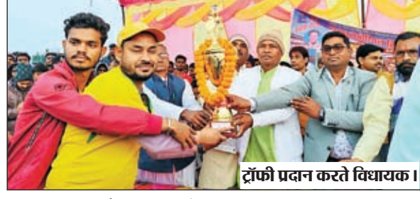
ट्राफी प्रदान करते विधायक।