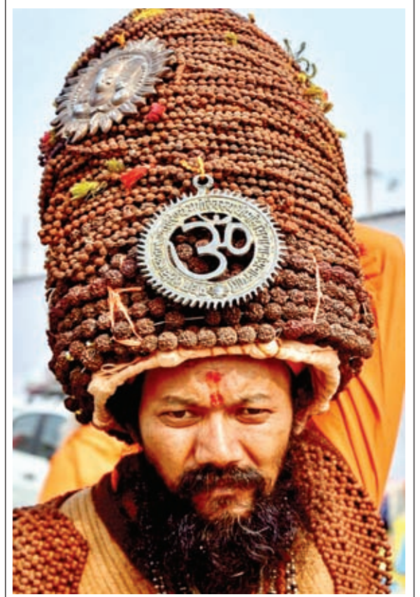
प्रयागराज। महाकुंभ में एक हटयोगी ने 12 वर्ष के संकल्प के साथ 45 किलो रुद्रक्ष माला की मनियों की टोपी धारण कर श्रद्धालुओं के आकर्षण का केंद्र बने हुए हैं।

है तो हम सब सुरक्षित हैं। उपासना विधि का अंतर हो सकता है, लेकिन राष्ट्रधर्म सर्वोपरि है। इससे कोई समझौता नहीं हो सकता। जनजातीय समुदाय प्राचीन काल (भगवान राम) के समय से ही देश व धर्म के लिए मजबूती के साथ जुटने वाले योद्धा के रूप में जाना जाता है। उन्होंने कहा कि महर्षि वाल्मीकि कृत रामायण में यह वर्णन बताया है कि ऋषि-मुनियों की साधना स्थली व दिव्य ज्ञान की भूमि दंडकारण्य जनजातीय संस्कृति व सभ्यता से भरा है। झारखंड, ओड़िशा से लेकर सुदूर महाराष्ट्र तक विस्तृत भूभाग है, जहां की जनजातीय संस्कृति ने ज्ञान-विज्ञान की धरोहर को संजोकर विपरीत परिस्थितियों में संरक्षण किया। जब भी राष्ट्र व धर्म के सामने चुनौती आई तो उसका मुकाबला करने के लिए खुद को तैयार किया।