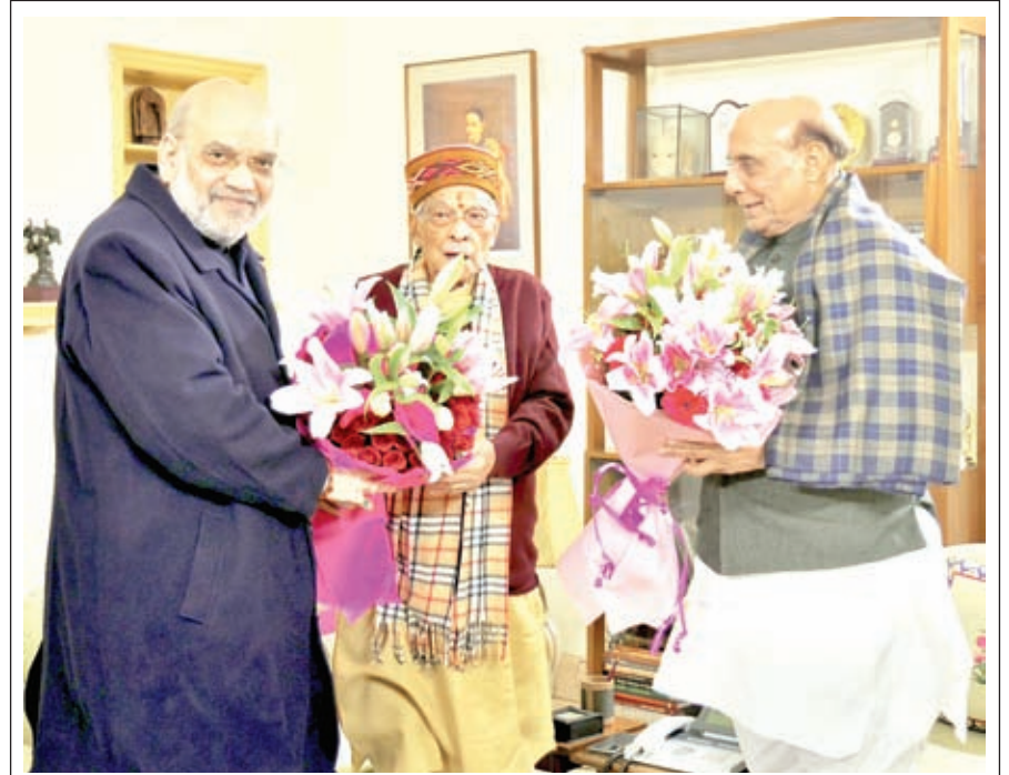
नयी दिल्ली में 92वें जन्मदिवस पर मुरली मनोहर जोशी को बधाई देते अभित शाह और राजनाथ सिंह।