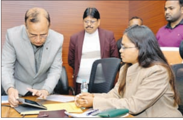
के साथ ऑनलाइन मीटिंग में योजनाओं की प्रगति रिपोर्ट की समीक्षा की। समीक्षा में रांची, खुंटी, धनबाद, गुमला और देवघर में

रांची। झारखंड की कृषि मंत्री शिल्पी नेहा तिकी ने भूमि संरक्षण विभाग की योजनाओं के क्रियान्वयन में सुस्ती पर कड़ी नाराजगी जतायी है। उन्होंने अधिकारियों को निर्देश दिया कि अगले दो दिनों में क्षेत्र के विधायकों से मिलकर योजना की जानकारी दें। उन्होंने कहा कि अधिकारियों की सुस्ती के कारण विभाग अपना लक्ष्य हासिल नहीं कर पा रहा है। उन्होंने शनिवार को एनआईसी सभागार में भूमि संरक्षण निदेशालय के साथ ऑनलाइन मीटिंग में योजनाओं की प्रगति रिपोर्ट की