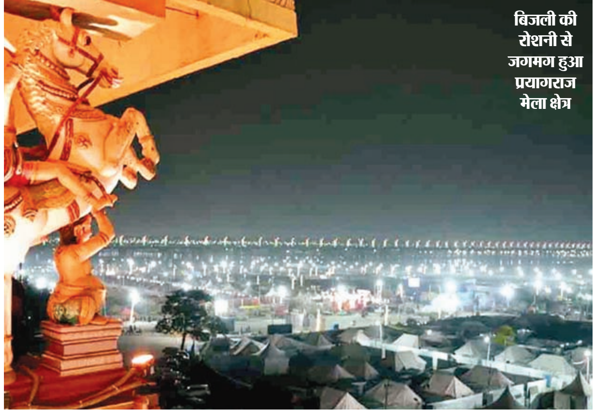
बिजली की रोशनी से जगमग हुआ प्रयागराज मेला क्षेत्र

वे मेला क्षेत्र में अपनी ड्यूटी के दौरान संवेदनशील रहें और श्रद्धालुओं के प्रति शालीन व्यवहार करें। किसी भी संदिग्ध गतिविधि पर तत्काल कार्रवाई की जाए। श्रद्धालुओं और संतों की उपस्थिति को ध्यान में रखते हुए सुरक्षा के पुख्ता इंतजाम किए गए हैं। थल, जल व नभ में सुरक्षा का चक्रव्यूह तैयार किया गया है। मेला क्षेत्र में निगरानी के लिए सीसीटीवी लगाए गए हैं।