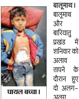
घायल बच्चा ।