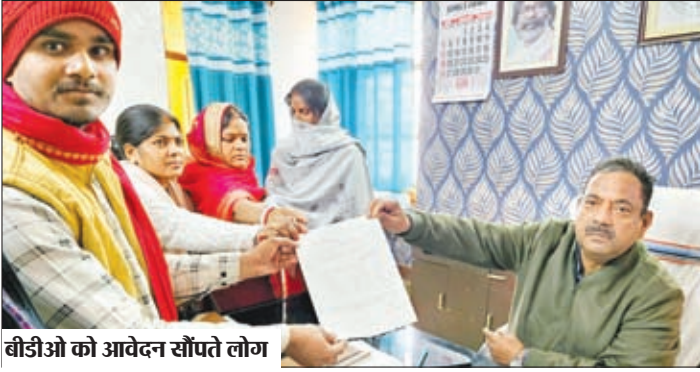
बीडीओ को आवेदन सौंपते लोग