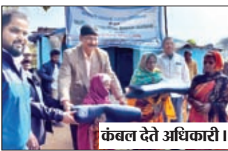
कंबल देते अधिकारी ।

लातेहार/चंदवा । पीवीयूनएल बनहरदी कोल परियोजना द्वारा सामुदायिक विकास कार्यक्रम के अंतर्गत बनहरदी कोयला खनन परियोजना से प्रभावित हो रहे क्षेत्र अंतर्गत बारी, सुरली व चेतार ग्राम में शिविर आयोजित