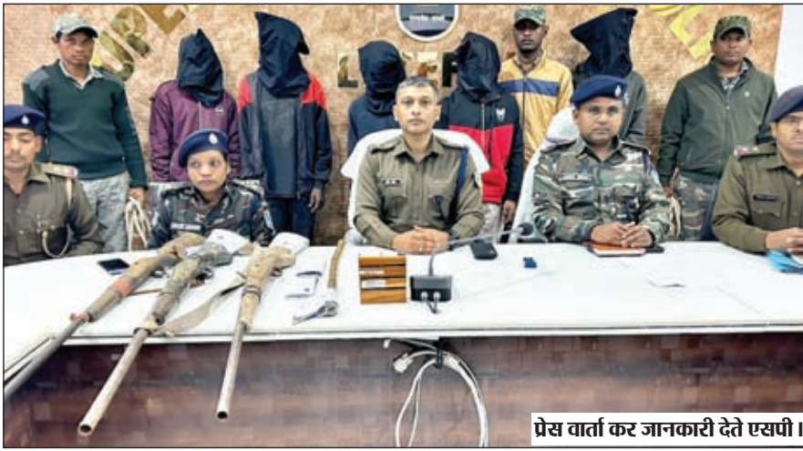
प्रेस वार्ता कर जानकारी देते एसपी ।