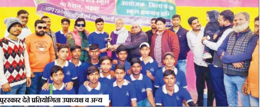
पुरस्कार देते प्रतियोगिता उपाध्यक्ष व अन्य