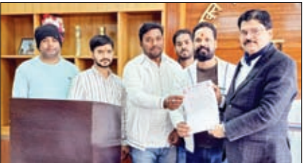
डीसी को आवेदन सौंपते पूजा समिति के पदाधिकारी

गढ़वा। शहर के टंडवा के सभी पूजा समिति अखाड़ों के प्रतिनिधियों ने डीसी से मुलाकात कर अपनी समस्याओं को प्रस्तुत किया। सभी पूजा समिति के पदाधिकारियों ने बताया कि टंडवा दानरो नदी पुल पर दोनों साइड लोहे का हाइट गैज (ब्रेकेटिंग) लगाया जा रहा है यह आम जनमानस के हित के लिए है लेकिन पूजा त्यौहार जैसे रामनवमी पूजा, दशहरा पूजा एवं मोहरम में इसी रास्ते से होते हुए गढ़वा शहर में प्रवेश करते हैं। दुर्गा पूजा में प्रतिमा का विसर्जन, रामनवमी में विशाल रथ भ्रमण तथा मोहरम में तजिया भ्रमण इसी रास्ते से होता है जो एक धार्मिक आस्था का विषय है। पदाधिकारियों ने बताया कि वह हाइट गैज को नट बोल्ट से फिट किया जाए। जिससे त्यौहार में दो से तीन दिन पहले विभाग से अनुमति लेकर पूजा कमिटी उसे खोल सकें तथा त्यौहार के बाद उसे फिर