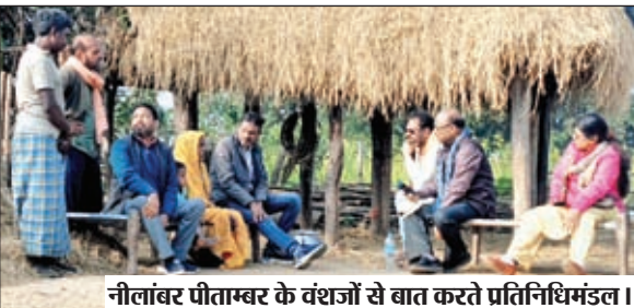
नीलांबर पीताम्बर के वंशजों से बात करते प्रतिनिधिमंडल ।