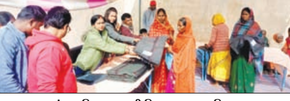
कंबल वितरण करती जिप अध्यक्ष व मुखिया