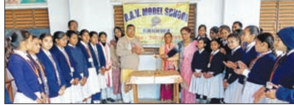
उपस्थित निदेशक व अन्य