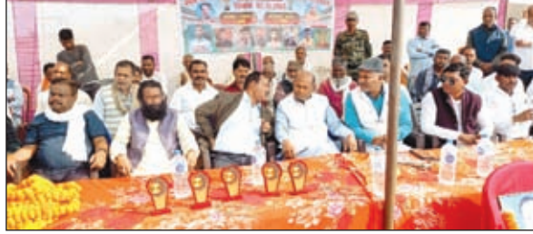
टूर्नामेंट के उद्घाटन में मौजूद मुख्य अतिथि (फाइल फोटो)