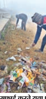
साफई करते युवा।

▶▶ लोगों से की अपील, प्लीज खेल स्टेडियम को गंद ना करें