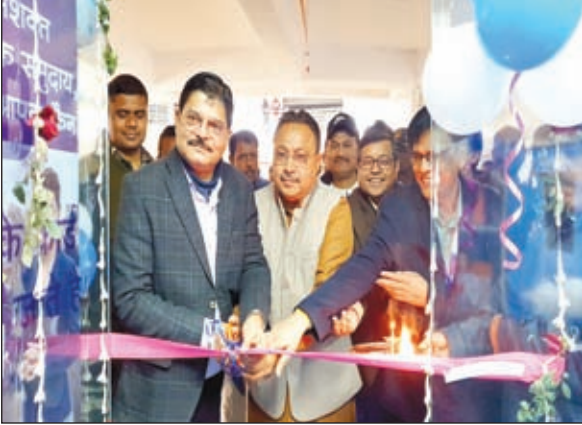
उद्घाटन करते डीसी

गढ़वा। भारतीय स्टेट बैंक के क्षेत्रीय व्यवसाय कार्यालय डाल्टनगंज के सौजन्य से गढ़वा समाहरणालय में लगाए गए एसबीआई एटीएम का शुक्रवार को जिला दण्डाधिकारी सह डीसी शेखर जमुआर ने फीता काटकर उद्घाटन किया। इस दौरान डीसी ने एसबीआई एटीएम की विशेषताओं की जानकारी लेने के उपरांत इसके सफल संचालन को लेकर संबंधित अधिकारियों को आवश्यक दिशा-निर्देश दिया। डीसी ने कहा कि एसबीआई का एटीएम लग जाने से समाहरणालय आने