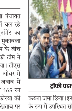
ट्रॉफी प्रदान करते अतिथि

कब्जा जमा लिया। इस अवसर पर मुख्य अतिथि के रूप में उपस्थित सोनपुरवा पंचायत के मुखिया