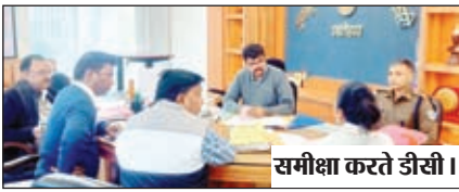
समीक्षा करते डीसी।

जिला आपदा प्रबंधन प्राधिकार की हुई बैठक, 69 अभ्यावेदनों की हुई समीक्षा