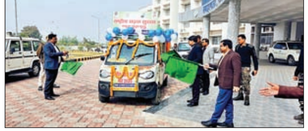
रवाना करते डीसी