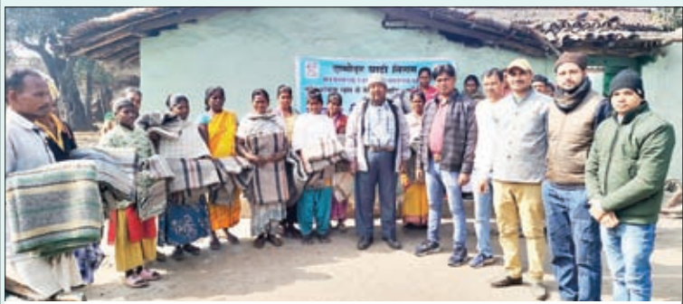
कंबल वितरण के दौरान मौजूद पदाधिकारी व ग्रामीण।