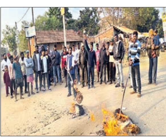
पुतला दहन करते ग्रामीण