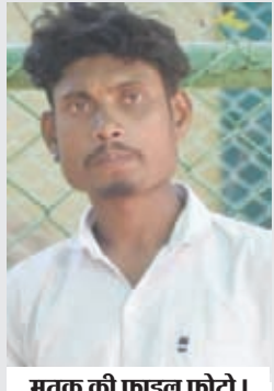
मृतक की फाइल फोटो।