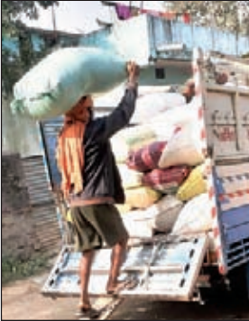
चोरी का समान बरामद करती पुलिस