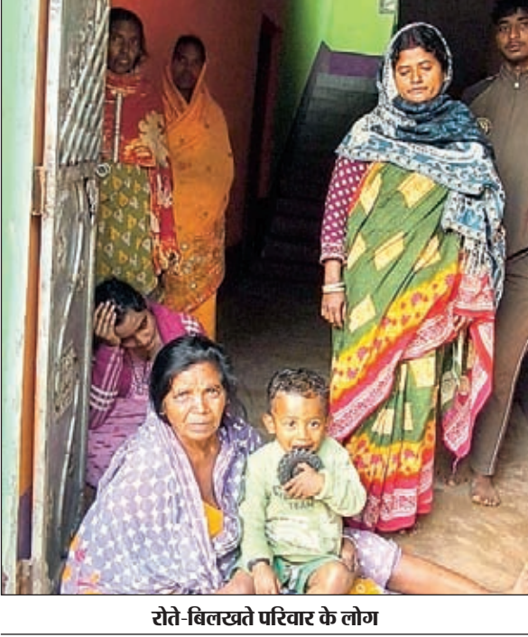
रोते-दिलखते परिवार के लोग