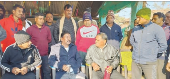
बेड़ो बाजार टांड स्थित सब्जी मंडी के शेड में बाजार समिति के पदाधिकारी से जानकारी लेते पूर्व मंत्री बंधु तिर्की व मौजूद ग्रामीण।

मंडी की स्थिति की जानकारी लिया। इसके बाद उन्होंने कार्यकर्ताओं व ग्रामीणों के साथ बेड़ो बाजार टांड स्थित सब्जी मंडी के समीप एक बैठक किया। उन्होंने कहा कि बेड़ो बाजार को एक मॉडल बाजार के रूप में विकसित किया जाएगा। यहां आवश्यक संसाधन व मूलभूत सुविधाएं मुहैया करायी जाएंगी। उन्होंने कहा कि रांची जिले के नगड़ी, मखमंदरो, ब्राम्बे, हुंटर और बेड़ो प्रमुख हाट हैं। जिसमें बेड़ो बाजार का सब्जी निर्यात के क्षेत्र में अपनी एक अलग पहचान है। यहां की सब्जियां देश के महानगरों में कलकत्ता, मुंबई सहित अन्य जगहों पर भेजी जाती