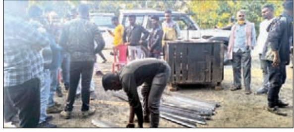
चोरी का समान बरामद करती पुलिस