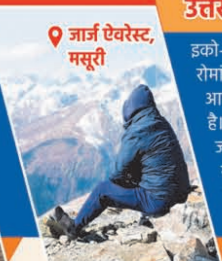
जार्ज एवेरेस्ट, मसूरी

सूचना एवं लोक सम्पर्क विभाग, उत्तराखण्ड द्वारा जनहित में जारी