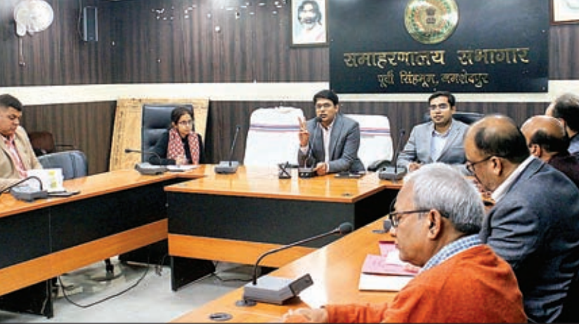
समाहरणालय सभागार में नोडल पदाधिकारी के साथ बैठक।

सम्मान योजना व अन्य विकास कार्यों की धरातल पर स्थिति से अवगत होते हुए रिपोर्ट करेंगे। पंचायत स्तर पर सरकार की संस्थाएं एवं उनके माध्यम से लोगों को दी जा रही बुनियादी सेवायें, सुविधायें तथा कल्याणकारी योजनाओं का क्रियान्वयन किस तरीके से धरातल पर हो रहा है, इसकी वस्तुस्थिति की जानकारी हासिल करने के उद्देश्य से जिला स्तर के नोडल पदाधिकारियों को क्षेत्र में भेजा जा रहा है। जिला दंडाधिकारी सह उपायुक्त ने कहा कि सभी नोडल पदाधिकारी प्रत्येक शनिवार को अनिवार्य रूप से अपने प्रखंड व नगर निकाय का क्षेत्र भ्रमण करेंगे।