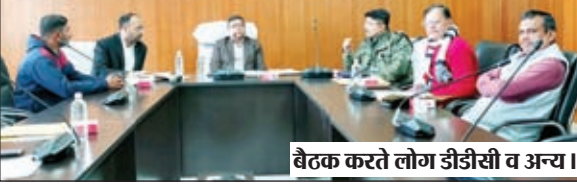
बैठक करते लोग डीडीसी व अन्य।