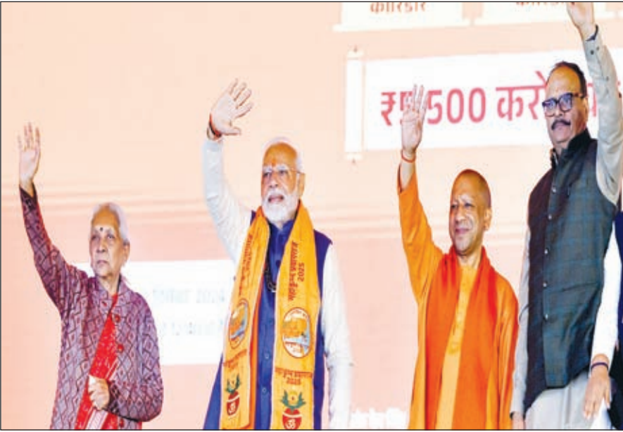
प्रयागराज में कई योजनाओं का लोकार्पण करते पीएम नरेंद्र मोदी, यूपी के सीएम योगी व राज्यपाल।

प्रधानमंत्री ने कहा कि अगर मुझे इस महाकुंभ का वर्णन करना हो तो मैं कहूंगा कि एकता का ऐसा महायज्ञ होगा जिसकी चर्चा पूरी दुनिया में होगी। इस आयोजन की भव्य एवं दिव्य सफलता की शुभकामनाएं देता हूँ। हमारा भारत पवित्र नदियों और तीर्थस्थलों का देश है। इन नदियों के प्रवाह को जो पवित्रता है, अनेकानेक तीर्थों का जो महत्व है, उनका संगम, उनका समुच्चय, संयोग, प्रभाव प्रताप