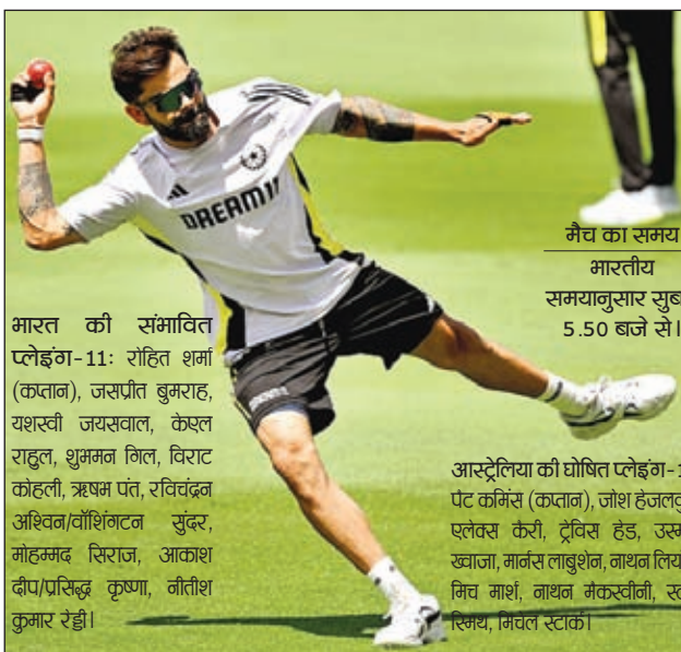
मैच का समय भारतीय समयावसार सुबह 5.50 बजे से।

भारत की संभावित प्लेइंग-11: रोहित शर्मा (कप्तान), जसप्रीत बुमराह, यशस्वी जयसवाल, केएल राहुल, शुभमन गिल, विराट कोहली, ऋषभ पंत, रविचंद्रन अश्विन/वॉशिंगटन सुंदर, मोहम्मद रिज़ाज, आकाश दीप/प्रसिद्ध कृष्णा, नीतीश कुमार रंझी।