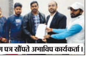
मांग पत्र सौंपते अमाविप कार्यकर्ता।