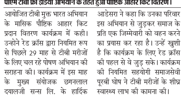
पीएम टीबी फ्री इंडिया अभियान के तहत हुआ पौष्टिक आहार किट वितरण।