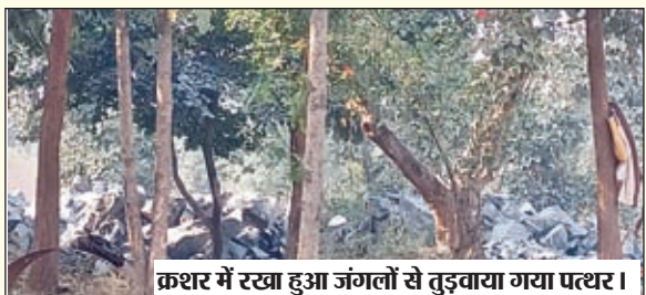
क्रशर में रखा हुआ जंगलों से तुड़वाया गया पत्थर।

कारोबारी मालामाल हो रहे हैं। वहीं सरकारी राजस्व का भारी नुकसान हो रहा है। जानकारों की