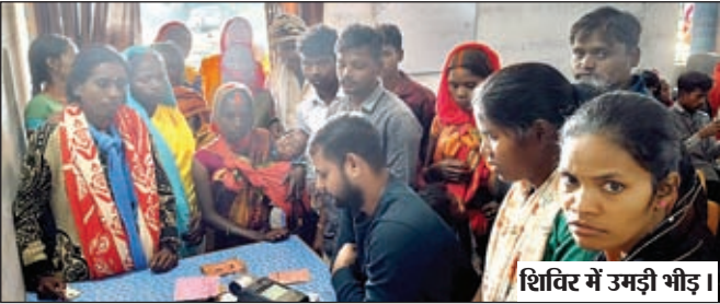
शिविर में उमड़ी भीड़।

बरवाडीह। बरवाडीह प्रखंड के विभिन्न पंचायत भवनों में राष्ट्रीय खाद्य सुरक्षा अधिनियम और झारखंड राज्य खाद्य सुरक्षा योजना से आच्छादित राशन कार्डधारकों के लिए आधार सीडिंग, ई-केवाईसी, आयुष्मान कार्ड बनाने और छूटे हुए लाभुकों को ग्रीन राशन कार्ड जारी करने के उद्देश्य से विशेष शिविर का आयोजन किया जा रहा है। लेकिन शिविर के दौरान अत्यवस्थाओं और खराब प्रबंध के चलते बड़ी संख्या में लाभुकों को निराशा का सामना करना पड़ रहा है। गुरुवार को खुदा पंचायत भवन में शिविर का आयोजन तो हुआ, लेकिन वहां व्यवस्थाओं की भारी कमी देखने को मिली। शिविर स्थल पर केवल एक डीलर