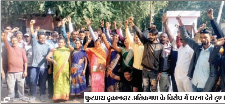
फुटपाथ दुकानदार अतिक्रमण के विरोध में धरना देते हुए।