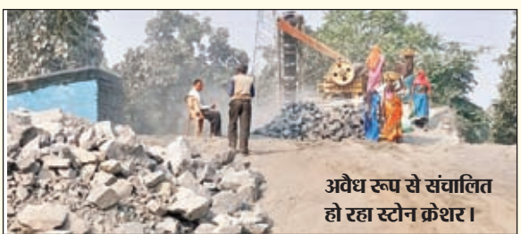
अवैध रूप से संचालित हो रहा स्टोन क्रशर।