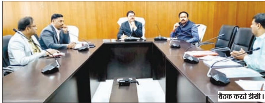
बैठक करते डीसी।

गढ़वा। डीसी शेखर जमुआर की अध्यक्षता में गुरुवार को समाहरणालय स्थित सभागार में कनहर परियोजना के संबंध में बैठक की गई। सोन कनहर अन्डरग्राउंड पाइप लाईन परियोजना अंतर्गत जल संसाधन विभाग द्वारा अधिग्रहित भूमि, जो ग्राम खैरा, टोटकी एवं सिंजो, पंचायत मदगड़ी (च) अंतर्गत है, उसमें एल एंड टी द्वारा अन्डरग्राउंड पाइप लाईन बिछाये जाने का कार्य किया जा रहा है, जिसके कारण जल संसाधन विभाग को वर्णित ग्रामों की भूमि क्षतिपूर्क वनरोपण के लिए वन विभाग, गढ़वा को दिया जायेगा। परन्तु उक्त कार्य के लिए उपरोक्त गांव के लोगों द्वारा कार्य योजना में कुछ गतिरोध उत्पन्न किये जा रहे हैं। बैठक के दौरान योजना कार्य पूर्ण करने में आ रहे गतिरोध के कारणों से डीसी को