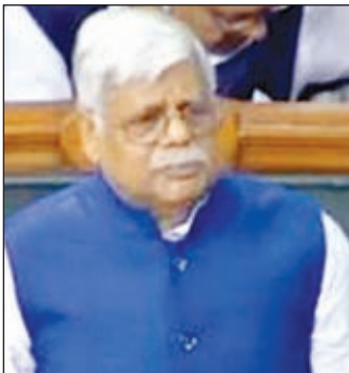
विष्णुदयाल राम, पलामू सांसद।

मेदिनीनगर। सांसद विष्णु दयाल राम ने लोकसभा में पलामू संसदीय क्षेत्र अंतर्गत गढ़वा जिला में सोन-कनहर पाइप लाइन सिंचाई परियोजना के कार्य को पूर्ण कराने से संबंधित अति महत्वपूर्ण मामले को उठाया। सांसद श्री राम ने कहा कि केंद्र सरकार द्वारा वर्ष 2017 में 1276 करोड़ रुपये की लागत से गढ़वा जिले की भूमि को सिंचित करने के लिये सोन-कनहर पाइप लाइन सिंचाई परियोजना का स्वीकृति प्रदान की गयी थी।