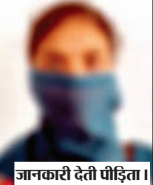
जानकारी देती पीड़िता।