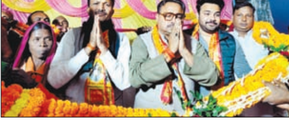
विधायक का स्वागत करते कार्यकर्ता