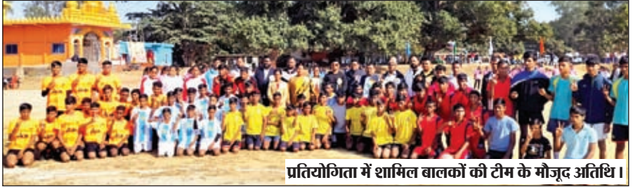
प्रतियोगिता में शामिल बालकों की टीम के मौजूद अतिथि।