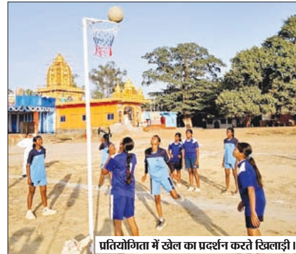
प्रतियोगिता में खेल का प्रदर्शन करते खिलाड़ी।