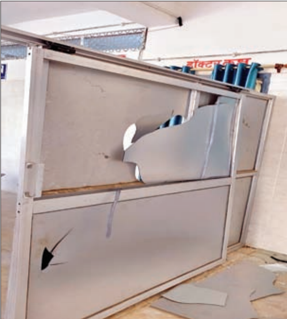
टूट गेट व थीशा