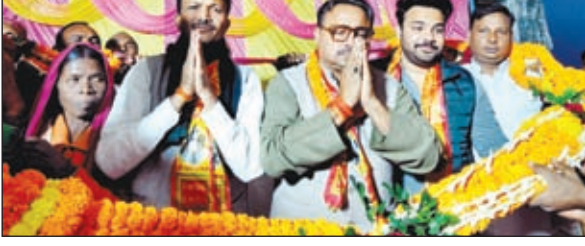
विधायक का स्वागत करते कार्यकर्ता