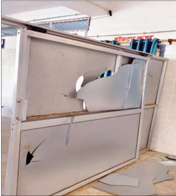
टूट गेट व थीशा