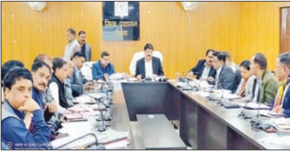
बैठक करते डीसी