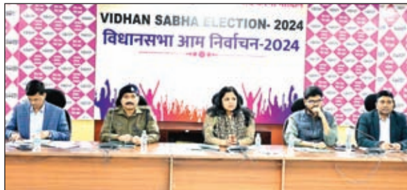
क्लास लगी है।

बैठक में उपयुक्त ने गोविंदपुर व निरसा में जाम की समस्या का समाधान निकालने, बैंक मोड़ फ्लाइंगओवर तथा सड़कों पर घूमने वाले आवारा पशुओं को लेकर संबंधित विभाग को त्वरित कार्रवाई करने का निर्देश दिया। पिछले एक सप्ताह से गोविंदपुर में जीटी रोड पर उत्पन्न महाजाम और उसे हटाने में विफलता को गंभीरता से लेते हुए उन्होंने एनएचआई को सर्विस रोड