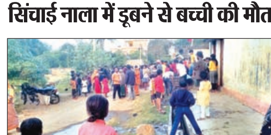
शव को देखने उमड़ी भीड़

बेरमो। बोकारो जिले के पेटरवार प्रखंड अंतर्गत चलकरी उत्तरी पंचायत के रजक टोला में अनुपम हनुमान मंदिर से रजक टोला शमशान घाट तक लगभग एक करोड़ की लागत से पीसीसी सड़क पर सड़क बनाए जा रहे हैं। इस सड़क निर्माण में कोयला और मिट्टी मिला चोरी का बालू इस्तेमाल किया जा रहा है। साथ ही कहा कि नियमित कम सीमेंट और अन्य सामग्री लगाया जा रहा है। सड़क के दोनों ओर दो-दो फीट ढलाई नहीं कर सूखा मिट्टी डाल कर सड़क चौड़ा किया जा रहा है।