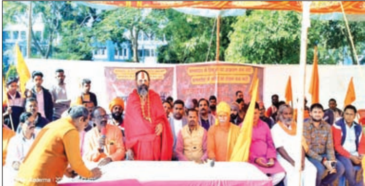
खबर मन्त्र संवाददाता

कोडरमा। बांग्लादेश में हिंदू समुदाय के साथ ही बौद्ध, सिख सहित अन्य अल्पसंख्यक समुदाय पर हो रहे अत्याचार के विरोध में गुरुवार को कोडरमा में सर्व सनातन समाज सड़कों पर उतरा और विरोध में आक्रोश रैली निकाल कर धरना दिया। प्रदर्शन कर रहे सर्व सनातन समाज ने कहा कि बांग्लादेश में रह रहे हिंदू अल्पसंख्यक आज खौफ और डर के साए में जी रहे हैं। बांग्लादेश में