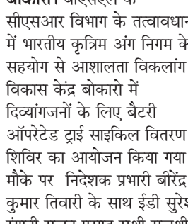
खबर मन्त्र संवाददाता

बोकारो। विगत वर्ष की भांति इस वर्ष भी बीएसएल के तत्वावधान में हैप्पी स्ट्रीट का आयोजन किया जाएगा। 15 दिसम्बर को सुबह 07 बजे इसका उद्घाटन किया जाएगा जिस दौरान बीएसएल के वरीय अधिकारियों सहित अन्य गणमान्य अतिथि उपस्थित रहेंगे। एक्टिव बोकारो हेल्दी बोकारो के थीम को आगे बढ़ाने के उद्देश्य से किए जा रहे इस आयोजन में बोकारो के विभिन्न स्कूल अन्य शिक्षण संस्थान महिला समिति संगीत कला अकादमी सीआरपीएफ सीआईएसएफ