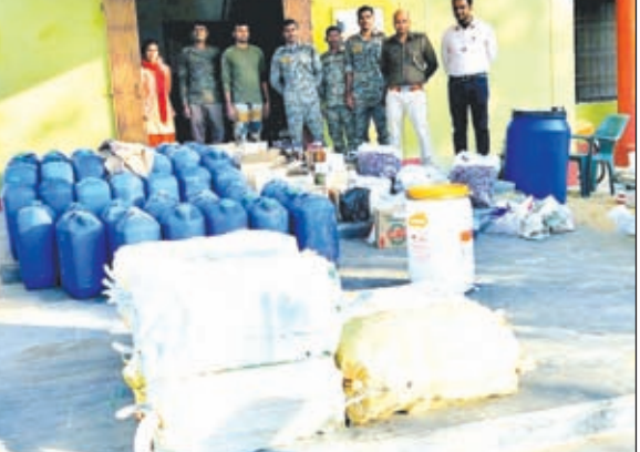
खबर मन्त्र संवाददाता

चतरा। उपायुक्त चतरा रमेश घोलप के निर्देश पर जिले में अवैध शराब के कारोबार एवं शराब कारोबारियों के विरुद्ध लगातार कार्यवाई की जा रही है। इसी क्रम में गुरुवार को उत्पाद विभाग के द्वारा इटखोरी थाना के सहयोग से इटखोरी थाना के पीछे पांच सौ मीटर ब्रम्हा चौक के समीप छापेमारी कर अवैध विदेशी शराब की मिनी फैक्ट्री का उद्घेदन किया गया। इस छापेमारी में विदेशी शराब (164.250 लीटर), रंगीन शराब (40 लीटर), स्पिरिट (630 लीटर), कैरेमल (5 लीटर), विभिन्न हिस्की के टक्कन, लेबल,