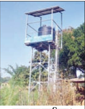
खराब पड़ा जलमिनार।

❑ पिछले कई माह से सोलर जलमिनार खराब रहने से ग्रामीणों को नहीं मिल रहा है पानी