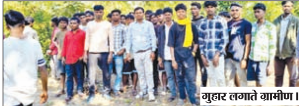
गुहार लगते ग्रामीण।

❑ मरमर व देवनदिया गांव में मचाया उत्पात, दर्जनों किसानों के खलिहानों में रखे धान के फसल को किया बर्बाद, ग्रामीण भयभीत