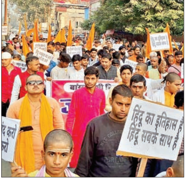
लखनऊ। बांग्लादेश में हिंदुओं पर हो रही हिंसा के खिलाफ मंगलवार को उत्तर प्रदेश के अधिकांश जिलों में हिन्दू रक्षा समिति के आड्डन पर धार्मिक और सामाजिक संगठनों ने जबर्दस्त प्रदर्शन किया।

चढ़कर 24,367.50 अंक पर खुला और सत्र के दौरान 24,280.00 अंक के निचले जबकि 24,481.35 अंक के उच्चतम स्तर पर रहा। अंत में पिछले सत्र के 24,276.05 अंक की तुलना में 0.75 प्रतिशत उछलकर 24,457.15 अंक पर बंद हुआ। इस दौरान सेंसेक्स की जिन कंपनियों ने मुनाफा कमाया उनमें अडानी पोर्ट्स 6.02, एनटीपीसी 2.60, एलटी 2.12, एसबीआई 2.12, एक्सिस बैंक 2.05, अल्ट्रासिंको 1.65, टाटा मोटर्स 1.42, एचडीएफसी बैंक 1.24, रिलायंस 1.09, एचसीएल टेक 0.95, इंडसइंड बैंक 0.92, टीसीएस 0.67, टाइटन 0.60, जेएसडब्ल्यू स्टील 0.60, पावरग्रिड 0.53, इंफोसिस 0.45, महिंद्रा एंड महिंद्रा 0.33, बजाज फाइनेंस 0.32, नेस्ले इंडिया 0.31, आईसीआईसीआई बैंक 0.27, टेक महिंद्रा 0.21, टाटा स्टील 0.10, हिंदुस्तान यूनिलिवर 0.09 और मारुति 0.06 प्रतिशत शामिल रही।