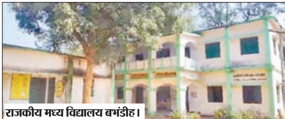
राजकीय मध्य विद्यालय बभंडीह।

बरवाडीह। राजकीय मध्य विद्यालय बभंडीह में शिक्षा व्यवस्था का हाल बद से बदतर हो गया है। कक्षा 1 से 8 तक के इस विद्यालय में कुल 175 बच्चों का नामांकन है। लेकिन नियमित उपस्थिति महज 60 से 70 बच्चों तक सिमत कर रह गई है। विद्यालय की स्थिति देखकर यह स्पष्ट होता है कि बच्चों के भविष्य के साथ खिलवाड़ किया जा रहा है। विद्यालय में पढ़ाई के लिए चार शिक्षक हैं। जिनमें एक प्रधानाध्यापक, एक सहायक शिक्षक और 2 शिक्षिकाएं शामिल हैं। लेकिन प्रधानाध्यापक विभागीय कार्यों का बहाना बनाकर अधिकतर समय विद्यालय से अनुपस्थित रहते हैं। अन्य शिक्षकों में से यदि किसी एक ने भी छुट्टी ले ली तो बाकी बचे दो शिक्षकों को पूरे विद्यालय का