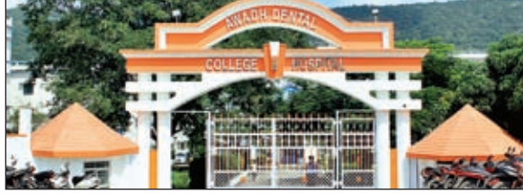
अवध डेंटल कॉलेज का प्रवेश द्वार।