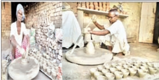
उचेलरी से लेकर शो रुम तक में तैयारी : 29 अक्टूबर को धनतेरस होगा, जबकि 31 अक्टूबर को दीपावली मनाई जाएगी। इसको लेकर उचेलरी शुरुआत पर तैयारी शुरू कर दी गई है। वहीं धनतेरस पर इलेक्ट्रिक बाइक, बाइक, कार, ट्रैक्टर, मोबाइल, बर्तन आदि की दुकानों पर भी खरीदारी की उम्मीद है।

कोडरमा। नवरात्र की समाप्ति के साथ ही व्यवसायी धनतेरस व दीपावली की तैयारी करना शुरू कर दिए हैं। दरअसल व्यवसायी धनतेरस, दीपावली, कालीपूजा, लक्ष्मी पूजा, चित्रगुप्त पूजा, छठ महाराजा जरासंध जयंती, गोपारथी मेले का लेकर तैयारी शुरू हो गई है। वहीं दीया बनाने वाले कुम्हारों की चाक भी तेज रफ्तार पकड़ ली है। दीये के साथ मिट्टी के खिलौने बनाने में लग गए हैं। विभिन्न समितियों द्वारा पूजा पंडाल एवं लाइटिंग की बुकिंग भी शुरू हो गई है। बताते चलें कि आने वाले धनतेरस और दीपावली से बड़ी उम्मीद है। बाजारों में जिस तरह का माहौल है, उसको देखते हुए गाड़ी, घर, टीवी, फ्रीज, आभूषण, बर्तन, इलेक्ट्रॉनिक उपकरण, सोफा, आलमारी, कपड़ा और दूसरे जरूरी सामानों की अच्छी बिक्री होने की उम्मीद है। वहीं ग्राहकों को आकर्षित