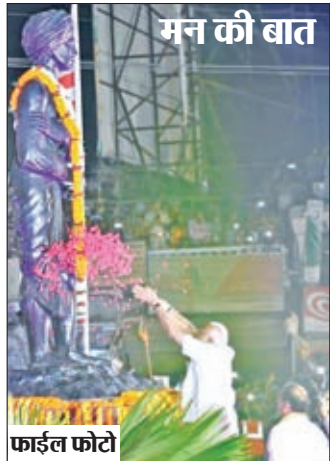
अक्टूबर और बिरसा मुंडा की 15 नवंबर

नयी दिल्ली (एजेंसी)। पीएम मोदी ने रविवार को अपने रेडियो कार्यक्रम मन की बात के 115 वें एपिसोड के जरिये देश के लोगों को संबोधित किया। इस दौरान उन्होंने अपने संबोधन में झारखंड का विशेष जिक्र किया। पीएम मोदी ने कहा उनकी सरकार धरती आबा भगवान बिरसा मुंडा और लौहपुरुष सरदार पटेल की 150 वीं जन्म जयंती मनायेगी। पीएम मोदी ने देश की जनता धरती आबा की 150 वीं जन्म जयंती भाग लेने की अपील की। उन्होंने कहा, लौह पुरुष सरदार पटेल से जुड़े अपने विचार और कार्य सोशल मीडिया पर साझा करें और धरती-आबा बिरसा मुंडा की प्रेरणाओं को दुनिया के सामने लायें। सरदार पटेल की 31