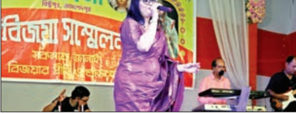
रंगारंग कार्यक्रम में प्रस्तुति देती बांग्ला गायिका।