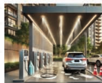
Car Wash Zone