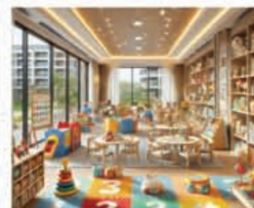
Child Day Care

An Oasis in the heart of Ranchi Luxurious 2/3/4 BHK and Penthouses