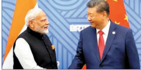
पर जोर दिया। बैठक के दौरान दोनों देशों के शीर्ष नेताओं ने इस बात पर सहमति बनायी कि दोनों देशों के

द्विपक्षीय बैठक हुई। भारतीय विदेश मंत्रालय ने बैठक के दौरान दोनों देशों के शीर्ष नेताओं के बीच हुई बातचीत का ब्यौरा दिया। विदेश मंत्रालय के मुताबिक प्रधानमंत्री मोदी ने पूर्वी लद्दाख में एलएसी पर पेट्रोलिंग को लेकर हुए समझौते का स्वागत किया। साथ ही दोनों देशों के बीच हुए मतभेदों और विवादों को ठीक से संभालने और शांति और सौहार्द को भंग न होने देने