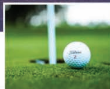
Mini Golf Course