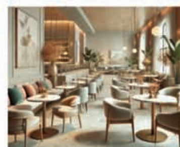
Cafe & Restro