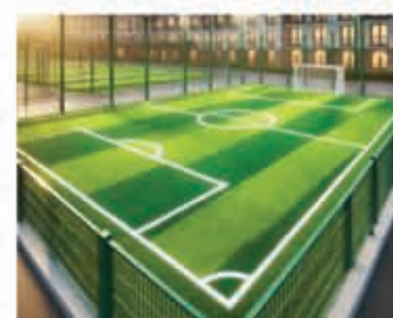
Mini Football Turf