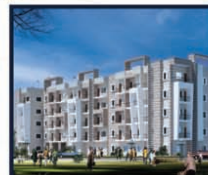
Pearl Crest Argora, Ranchi