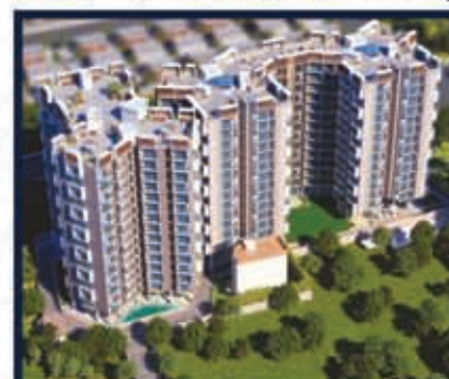
Pearl Orchid Argora, Ranchi