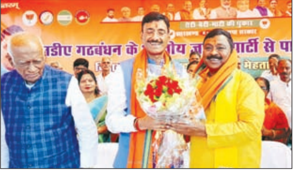
कार्यक्रम के दौरान मंच पर उपस्थित केंद्रीय रक्षा राज्य मंत्री संजय सेठ का स्वागत करते निवर्तमान विधायक डॉ शशिभूषण, जिलाध्यक्ष अमित तिवारी व उपस्थित भाजपा समर्थक।

नीलांबर पीतांबरपुर पलामू। पांकी विधानसभा से भाजपा के उम्मीदवार डॉक्टर कुशवाहा शशि भूषण मेहता के नामांकन सभा का आयोजन नीलांबर पीतांबरपुर पुराना प्रखंड कार्यालय परिसर में किया गया। नामांकन सभा के मुख्य अतिथि भारत सरकार के रक्षा राज्य मंत्री संजय सेठ उपस्थित थे। नामांकन सभा की अध्यक्षता जिलाध्यक्ष अमित तिवारी