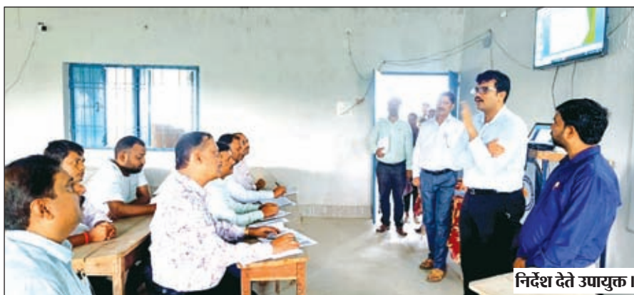
निर्देश देते उपायुक्त।