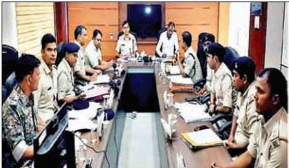
कार्रवाई करने का निर्देश दिया। डीआईजी ने उन नंबरों का भी