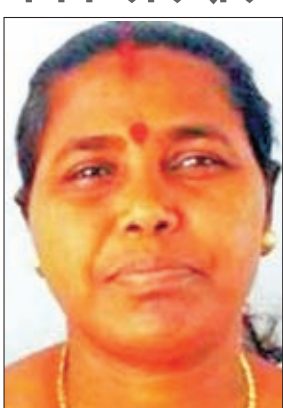
प्रभाव से इस्तीफा देती हूं। कृपया स्वीकार करने का कष्ट करें।

बाबूलाल मरांडी को भेजे हाथ से लिखी 25 शब्दों की चिट्ठी में उन्होंने सिर्फ इतना लिखा है कि मैं भारतीय जनता पार्टी की प्राथमिक सदस्यता के साथ ही तमाम पदों से तत्काल