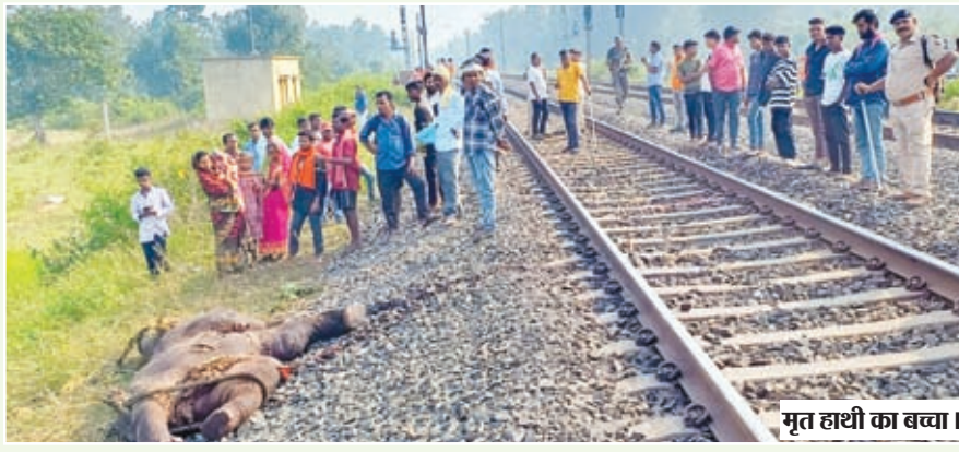
मृत हाथी का बच्चा।

मिली जानकारी के अनुसार शुक्रवार की देर रात्रि लगभग 15 की संख्या में जंगली हाथियों का झुंड बरकाकाना-बरवाडीह रेलखंड अंतर्गत केकराही गांव के समीप रेल पट्टी को पार कर रहा था। इसी दौरान डाउन लाइन पर मालगाड़ी आ गई, जिसके चपेट में एक जंगली हाथी का बच्चा आ गया व ट्रेन के इंजन में फंसेकर हाथी का बच्चा लगभग 100 मीटर तक रेलवे ट्रैक पर घसीटला चला गया व हाथी का बच्चा मालगाड़ी में इंजन के नीचे फंसे होने के कारण गाड़ी को घटनास्थल पर ही रोकना पड़ गया। इधर ट्रेन की चपेट में आने से हाथी के बच्चे की मौत के बाद हाथियों का झुंड घटनास्थल के समीप खेत में डेरा जमाए रहा व बच्चे की मौत पर चीत्कार करता रहा। वन विभाग की टीम किसी प्रकार हाथियों को झुंड को घटना स्थल से दूर किया, जिसके बाद राहत व बचाव कार्य शुरू हो पाया। इसके बाद घंटों मशवकत के बाद लगभग सुबह 8:15 बजे हाथी के शव को हटया गया, इसके बाद परिचालन सामान्य