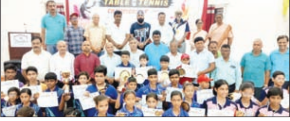
खिलाड़ियों के साथ पदाधिकारी