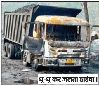
धू-धू कर जलता हाड़वा।