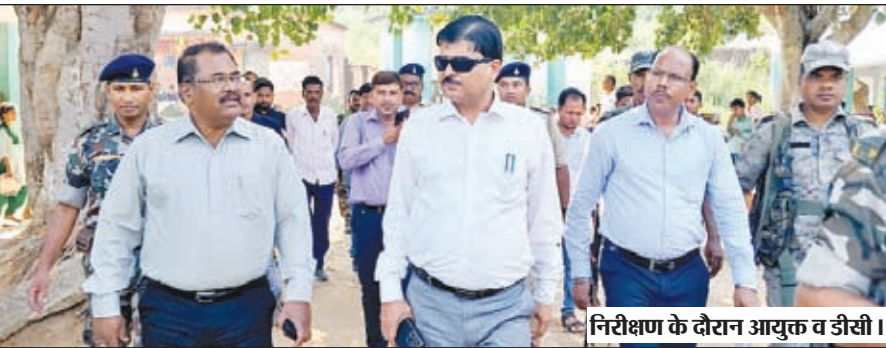
निरीक्षण के दौरान आयुक्त व डीसी।

केंद्रों पर रैप, व्हील चेयर, चेयर की उपलब्धता का आकलन किया। साथ ही वोलेंटरियर का सहयोग लेने संबंधी जानकारी ली। उन्होंने मतदान केंद्रों पर कार्यरत बीएलओ एवं उपस्थित पदाधिकारियों से निर्वाचन आयोग द्वारा जारी गाइडलाइन के तहत किये जा रहे कार्यों की अद्यतन स्थिति से अवगत हुए। उन्होंने मतदान केंद्रों के मतदान कक्ष में मतदान के दिन के लिए पर्याप्त प्रकाश व्यवस्था, पंखा को ठीक एवं चालू स्थिति में रखने का निर्देश दिया। आयुक्त ने मतदान केंद्रों पर महिला एवं पुरुष के लिए अलग-अलग शौचालय व्यवस्था को भी देखा और वहां रनिंग वाटर की व्यवस्था एवं शौचालय जाने के