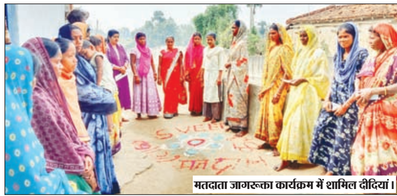
मतदाता जागरूकता कार्यक्रम में शामिल दीर्घियां।

बढ़ोतरी के साथ-साथ लोगों को मताधिकार के प्रति जागरूक करना है कि सभी के भागीदारी से ही सशक्त सरकार का निर्माण होगा। इस लोकतंत्र के महापर्व में हम सभी को मतदान