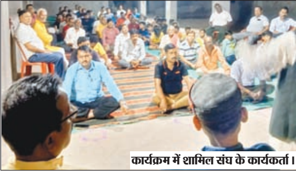
कार्यक्रम में शामिल संघ के कार्यकर्ता।

बुधबाजार शिव मंदिर व बरेनी गांव में संघ ने मनाया शरद पूर्णिमा उत्सव