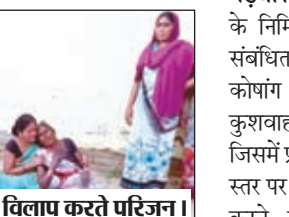
विलाप करते परिजन।

कांडी। सोन नदी में नहाने के क्रम में भाई बहन की मौत हो गई। भवनाथपुर थाना क्षेत्र अंतर्गत हरिहरपुर ओपी