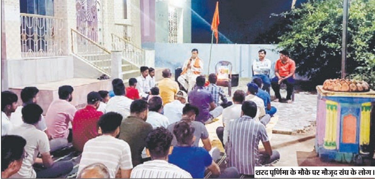
शरद पूर्णिमा के मौके पर मौजूद संघ के लोग।