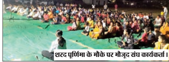
शरद पूर्णिमा के मौके पर मौजूद संघ कार्यकर्ता।

चंदवा में राष्ट्रीय स्वयं सेवक संघ ने धूमधाम से मनाया शरद पूर्णिमा उत्सव