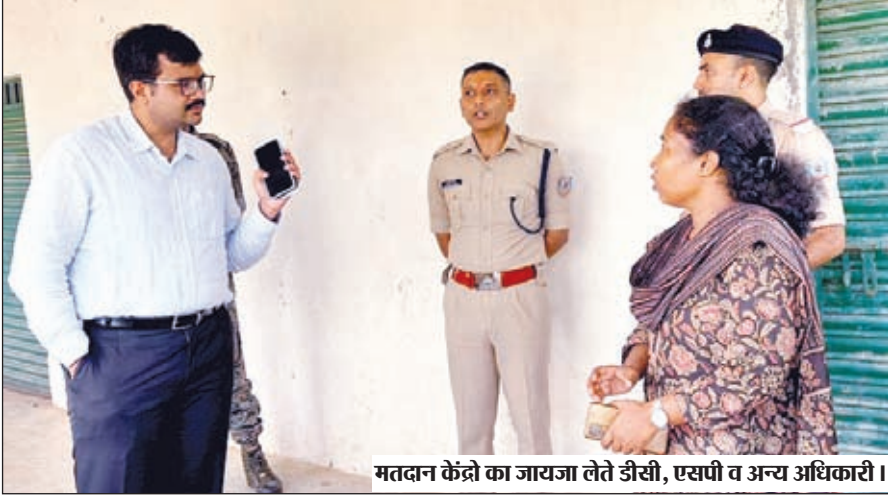
मतदान केंद्रों का जायजा लेते डीसी, एसपी व अन्य अधिकारी।

मतदाताओं को जागरूक करने के उद्देश्य से स्वीप के तहत रंगोली, मतदाता सिग्नेचर, मतदाता जागरूकता शपथ का हुआ आयोजन