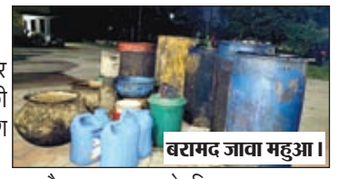
वराभद जावा महुआ।

मझिआंव। विधानसभा के चुनावी बिगुल बजते ही चुनाव को सफल संभालन को लेकर जिला प्रशासन अलर्ट हो चुकी है। पुलिस अधीक्षक के निर्देश पर थाना प्रभारी आकाश