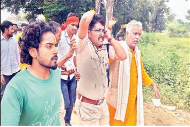
घायल पुलिस कर्मी, लाठीचार्ज करती पुलिस

पुलिस-ग्रामीण विवाद के बाद पथराव, डीएसपी घायल, लाठीचार्ज, आंसू गैस के गोले भी दागे गये