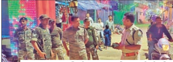
व्यवस्था का निरीक्षण करते एसडीपीओ।

लातेहार। जिले में धूम-धाम के साथ दशहरा पर्व संपन्न। नवरात्र के दौरान इन नौ रूपों की पूजा की जाती है। नवरात्र के पहले दिन मां शैलपुत्री की पूजा की जाती है, दूसरे दिन मां ब्रह्मचारिणी की, तीसरे दिन मां चंद्रघंटा की, चौथे दिन मां कूर्मांडा की, पांचवें दिन मां स्कंदमाता की, छठे दिन मां कात्यायनी की, सातवें दिन मां कालरात्रि की, आठवें दिन मां महागौरी की, और नौवें दिन मां सिद्धिदात्री की पूजा की जाती है। नवरात्र के नौ दिनों में देवी दुर्गा के नौ रूपों की पूजा की जाती है, इसलिए इसे नवदुर्गा भी कहा जाता है। नवरात्र का त्योहार सामुदायिक और सांस्कृतिक पहचान को बढ़ावा देता है। नव दिन पूजन के बाद दशमी को भगवान स्वरूप बने प्रतिमा को