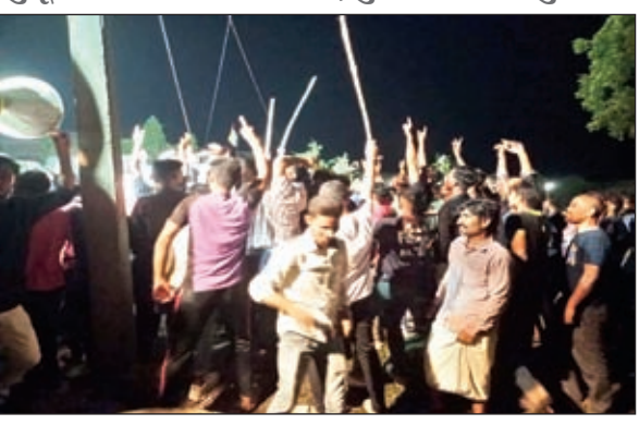
हंगामा करते लोग व घटनास्थल पर पुलिस कर्मी

जुलूस का पथरों से स्वागत, पुलिसकर्मी भी हुए घायल, रतभर बना रहा तनाव, प्रशासन बना रहा मुकदर्शक