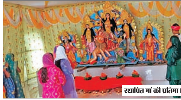
स्थापित मां की प्रतिमा।

लातेहार। लातेहार जिला अंतर्गत सुरद्वर्ती कुलगड़ा ग्राम में लगातार 61 वें वर्ष दुर्गापूजा धूमधाम के साथ मनाई गई। सार्वजनिक दुर्गापूजा समिति कुलगड़ा के द्वारा बनाया गया भव्य पूजा पंडाल क्षेत्र में आकर्षण का केंद्र रहा। शनिवार की देर शाम संध्या आरती के पश्चात मां के प्रतिभा को विसर्जन किया गया जहां भक्तों ने नम आंखों से मां को विदाई दी। इसके पूर्व विजयदशमी के मौके पर भव्य जतरा मेला का आयोजन भी किया गया। जिसमें आसपास के कई गांवों से हजारों की संख्या में लोग शामिल हुए। बता दें कि लखपुर पंचायत अंतर्गत कुलगड़ा ग्राम में लगातार 61 वें वर्ष दुर्गापूजा मनाई