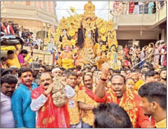
मूर्ति विसर्जन में शामिल मंत्री मिथिलेश