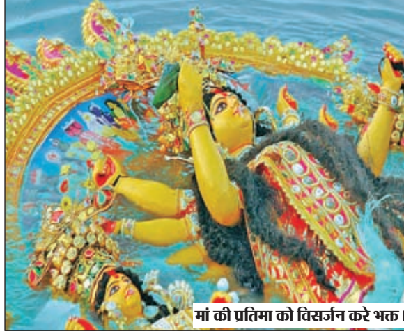
मां की प्रतिमा को विसर्जन करे भक्त।