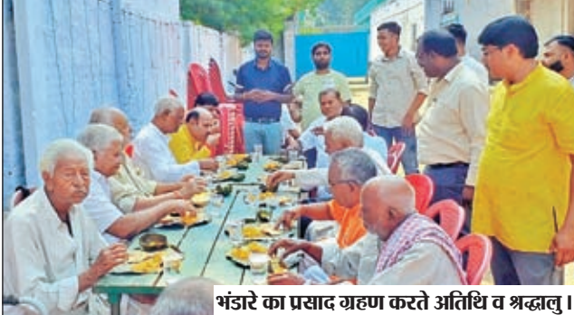
भंडारे का प्रसाद ग्रहण करते अतिथि व श्रद्धालु।