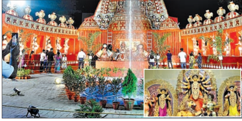
कदमा फार्म एरिया में बने भव्य पंडाल और उसके सामने का फव्वारा दर्शकों को लुभा रहा है और कदमा फार्म एरिया पंडाल में स्थापित प्रतिमा (इनसेट)।