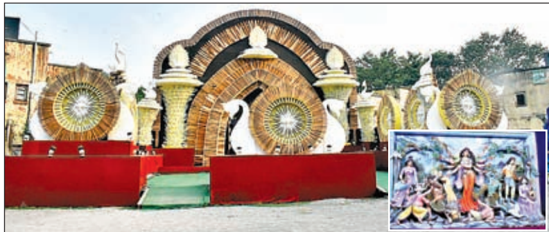
रेलवे कालोनी टाटानगर में बना भव्य पंडाल और रेलवे कालोनी पंडाल में स्थापित प्रतिमा (इनसेट)।