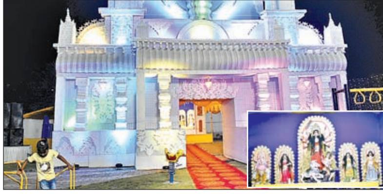
एयर वेस कालोनी कदमा में बना दुर्गापूजा पंडाल और एयरवेस कालोनी कदमा में स्थापित प्रतिमा (इनसेट)।