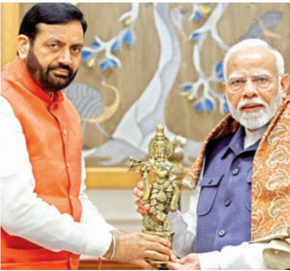
प्रधानमंत्री नरेंद्र मोदी से मिलते हरियाणा के सीएम सैनी

कार्यक्रम में महाराष्ट्र के लोगों से देश के विकास को सर्वोपरि रखते हुए और एकजुट होकर भाजपा और उसके गठबंधन महायुक्तिके पक्ष में मतदान करने की अपील की। हरियाणा के चुनाव परिणामों का उल्लेख करते हुए मोदी ने कहा कि इसने बत दिया है कि आज देश का मिजाज क्या है। उन्होंने कहा कि कांग्रेस का पूरा इकोसिस्टम, अर्बन नक्सल का पूरा गिरोह जनता को गुमराह करने में जुटा था लेकिन उसकी सारी साजिशें ध्वस्त हो गईं। उन्होंने दलितों के बीच झूठ फैलाने की कोशिश की लेकिन दलित समाज ने उनके खतरनाक इरादों को पूर्व लिया। दलितों को एहसास हो गया कि कांग्रेस उनका आरक्षण छीन कर अपने वोट बैंक को बांटना चाहती है। उन्होंने कहा कि