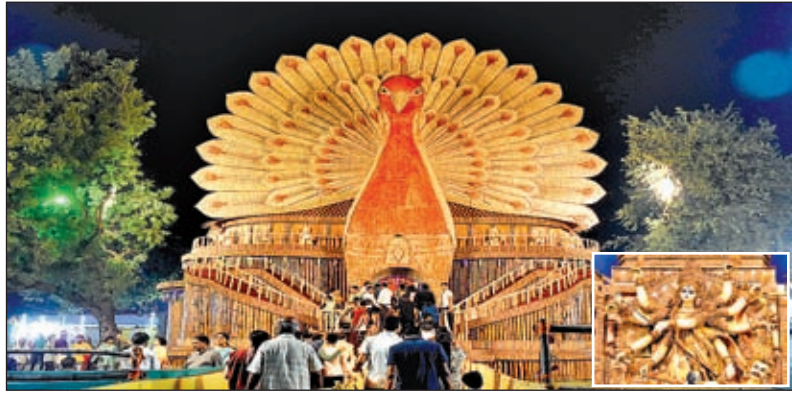
एथिको वलब हाउस परिसर में बना भव्य दुर्गापूजा पंडाल। यह पंडाल 75 फीट ऊंचा है और एथिको वलब हाउस पंडाल में स्थापित मां दुर्गा की प्रतिमा (इनसेट)।