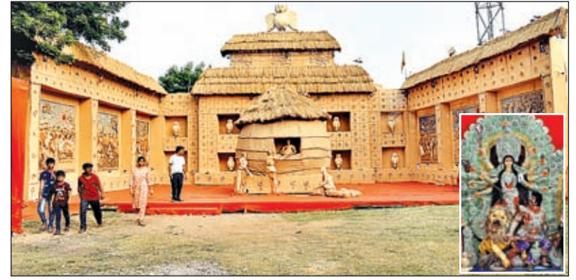
बागबेड़ा रोड नंबर-4 में बना भव्य पंडाल और बागबेड़ा रोड नंबर 4 के पंडाल में स्थापित मां दुर्गा की प्रतिमा (इनसेट)।