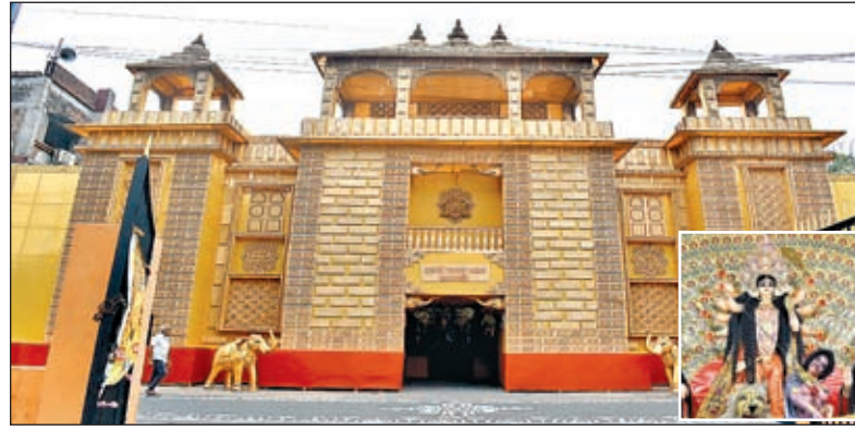
इवनिंग क्लब टिनप्लेट में बना भव्य दुर्गापूजा पंडाल और इवनिंग क्लब टिनप्लेट के पंडाल में स्थापित प्रतिमा (इनसेट)।