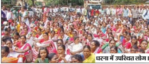
धरना में उपस्थित लोग।