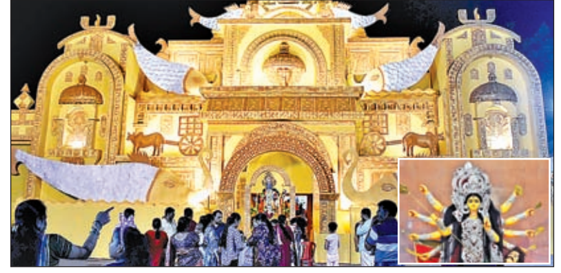
वारीडीह मार्केट में बना भव्य दुर्गापूजा पंडाल और वारीडीह पंडाल में स्थापित मां दुर्गा की प्रतिमा (इनसेट)।