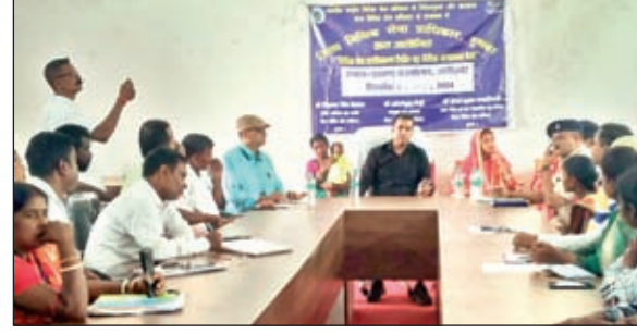
लाभुकों के बीच योजनाओं का लाभ देते न्यायाधीश