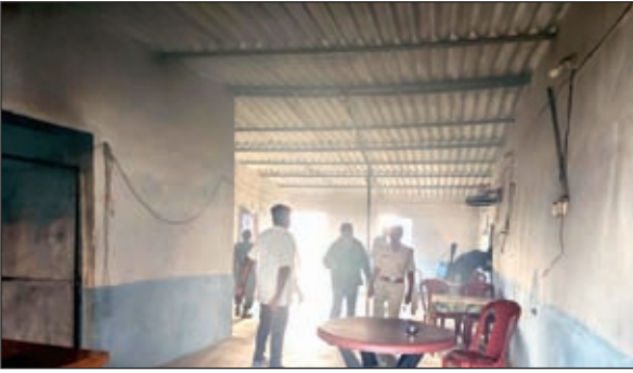
अचानक छापेमारी से होटल संचालकों में हड़कंप मच गया।

चतरा (टंडवा)। पिपरवार कोयलांचल क्षेत्र में कई होटलों व लाइन होटलों में पर्व त्योहारों में अवैध शराब की बिक्री की सूचना पर अवैध शराब के विक्रेताओं के विरुद्ध चतरा उत्पाद विभाग की टीम ने बड़ी कार्रवाई की है। उत्पाद विभाग द्वारा की गई कार्रवाई में सेरनदाग से एनटीपीसी तक मुख्य सड़क स्थित कई होटलों में