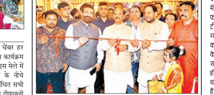
सिदगोड़ा में भव्य दुर्गापूजा पंडाल का उद्घाटन ओडिसा के राज्यपाल रघुवर दास ने किया। इस अवसर पर संरक्षक चंद्रगुप्त सिंह समेत पूजा कमेटी के अन्य पदाधिकारीगण उपस्थित थे।