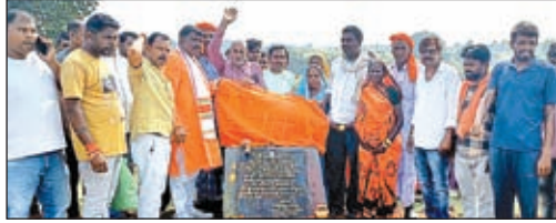
योजनाओं का शिलान्यास करते विधायक व उपस्थित अन्य।

पुरे पांकी विधानसभा में लगभग 84 करोड़ 51 लाख के लागत से विभिन्न योजनाओं का शिलान्यास