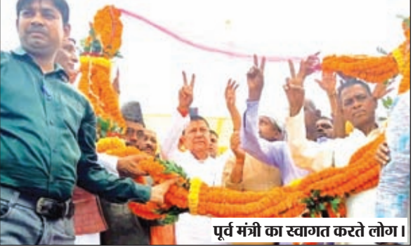
पूर्व मंत्री का स्वागत करते लोग।