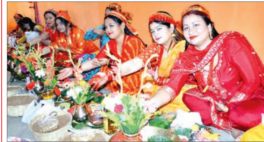
डोरंडा जैप-1 में नवरात्र के पहले दिन कलश स्थापना में शामिल महिलाएं।