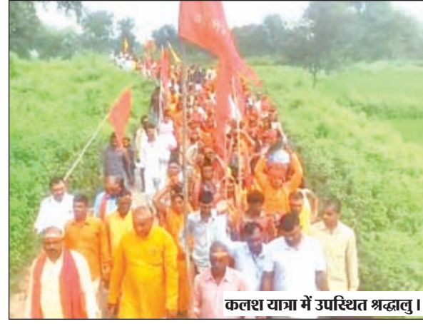
कलश यात्रा में उपस्थित श्रद्धालु।