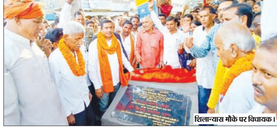
शिलान्यास मौके पर विधायक।

भवनाथपुर। भवनाथपुर से केतार होते हुए पाचाडुमर मुख्य पथ सुदृढीकरण निर्माण का शिलान्यास गुरुवार को खरौंधी मोड़ के समीप विधायक भानु प्रताप शाही की उपस्थिति में बुजुर्ग चंद्रदेव राउत ने पूजा अर्चना के बाद नारियल फोड़कर तथा शिलापट्ट का अनावरण कर किया। उक्त सड़क का निर्माण पथ निर्माण के तहत करीब 14 करोड़ की लागत से बनाई जायेगी। मौके पर विधायक श्री शाही ने कहा कि इस सड़क को अपने मंत्रित्वकाल में बनवाया था, जो समय के साथ खराब होने लगी थी, जिसे देखते हुए दुबारा इस चमचमती सड़क निर्माण के लिए आज शिलान्यास किया हूँ। आज