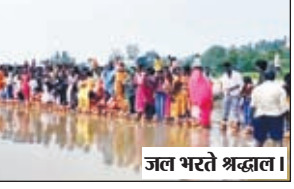
जल भरते श्रद्धालु।

मझिआंव। शारदीय नवरात्र शुरू होते ही मझिआंव नगर पंचायत सहित प्रखंड के ग्रामीण क्षेत्रों में वातावरण पूरी तरह से भक्तिमय हो