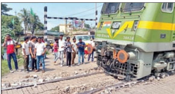
क्षतिग्रस्त रेल पटरी के पास मालगाड़ी का इंजन।

हमारे चांडिल सांवादादा के अनुसार इस दुर्घटना के बाद रेलवे फाटक क्रॉसिंग के पास रेल पटरी पूरी तरह क्षतिग्रस्त हो गई। इसकी वजह से उस रूट पर यातायात