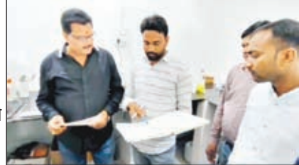
आदेश के बावजूद सीएचसी के सामने संचालित हो रहा है मेडिकल और पैथोलॉजी जांच घर।