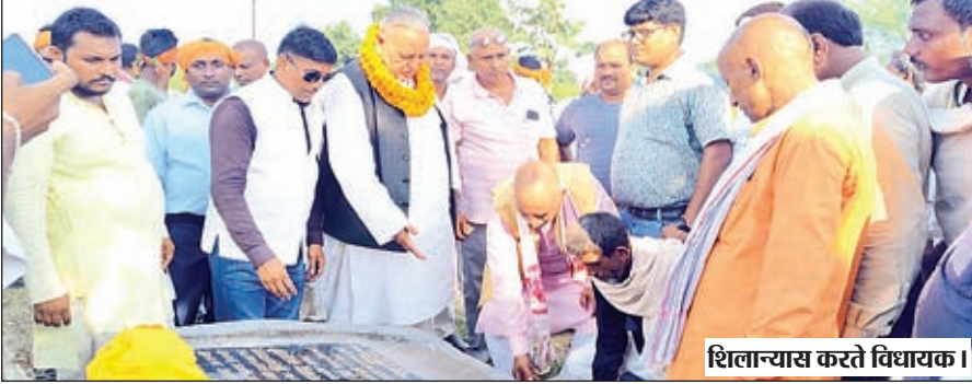
शिलान्यास करते विधायक।

स्तरीय पुल निर्माण का शिलान्यास, करुई गांव में मां कामाख्या धाम मंदिर का चाहरदीवारी निर्माण का उद्घाटन किया। वहीं ग्रामीण कार्य विभाग के तहत मुख्यमंत्री ग्राम