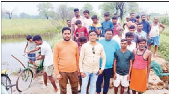
हंगामा करते ग्रामीण

खबर मन्त्र संवाददाता मझिआंव। गढ़वा जिले के मझिआंव नगर पंचायत क्षेत्र एवं प्रखंड क्षेत्रों में कई सड़कों का बुरा हाल है। वहीं बुढ़ीखांड-करमडीह हाइवा अघौरा दुबे तहले का जो बुरा हाल है उसे ब्यां नही किया जा सकता है। इस सड़क से खरसोता भाया चाका, अघौरा, दुबेतहले,