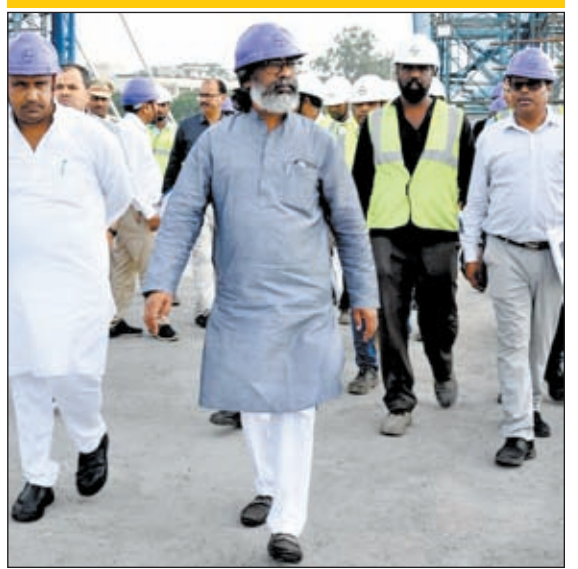
मुख्यमंत्री हेमंत सोरेन ने मेकॉन चौक से सिरमटोली चौक तक बन रहे प्लाईओवर का शनिवार को औचक निरीक्षण किया।