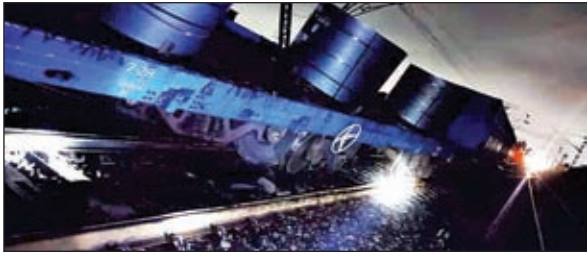
की सूचना मिलते ही मंडल नियंत्रण कक्ष सक्रिय हो गया तथा अधिकारी

बोकारो। दक्षिण पूर्व रेलवे के आद्रा मंडल अंतर्गत तुपकाडीह रेलवे स्टेशन यार्ड में एक मालगाड़ी पटरी से उतर गई। गाड़ी के पिछले हिस्से की 8वीं और 9वीं वैगन पटरी से उतर जाने के कारण अप और डाउन दोनों लाइनों पर ट्रेनों का परिचालन प्रभावित हुआ। घटना