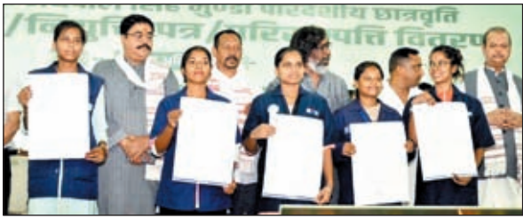
मुख्यमंत्री हेमंत सोरेन के साथ स्कॉलरशिप पाने वाले विद्यार्थी।

रांची। मुख्यमंत्री हेमंत सोरेन ने कहा कि राज्य सरकार अपने संसाधनों से झारखंड के 20 लाख आवास विहीन परिवारों को अबुआ आवास योजना के तहत तीन कमरों का पक्का मकान उपलब्ध करा रही है। सीएम ने कहा कि उनकी सरकार ने किसानों के 2 लाख रुपये तक के कृषि ऋण को माफ किया। राज्य सरकार झारखंड के बिजली उपभोक्ताओं को 200 यूनिट बिजली मुफ्त उपलब्ध करा रही है वहीं पुराने बिजली बिल को माफ भी किया गया है। यह बातें मुख्यमंत्री उन्होंने शनिवार को खेलगांव के हरिवंश टाना भगत इंडोर स्टेडियम में आयोजित मरांग गोमके जयपाल सिंह मुंडा पारदेशीय छात्रवृत्ति शिलान्यास, नियुक्ति पत्र एवं परिसंपत्ति वितरण कार्यक्रम में कही।