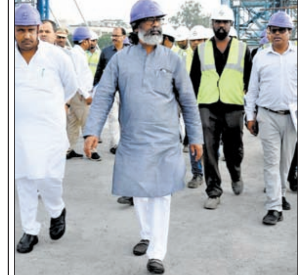
मुख्यमंत्री हेमंत सोरेन ने मेकॉन चौक से सिरमटोली चौक तक बने रहे प्लाईओवर का शनिवार को औचक निरीक्षण किया।