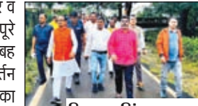
शिवराज सिंह व अन्य।