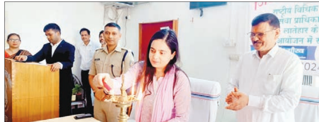
लोक अदालत का शुभारंभ करती डीसी व अन्य।