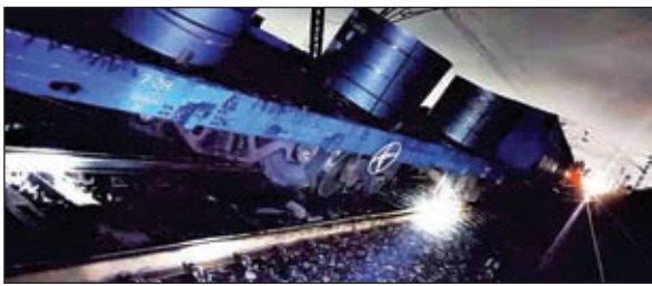
की सूचना मिलते ही मंडल नियंत्रण कक्ष सक्रिय हो गया तथा अधिकारी

बोकारो। दक्षिण पूर्व रेलवे के आद्रा मंडल अंतर्गत तुपकाडीह रेलवे स्टेशन यार्ड में एक मालगाड़ी पटरी से उतर गई। गाड़ी के पिछले हिस्से की 8वीं और 9वीं वैगन पटरी से उतर जाने के कारण अप और डाउन दोनों लाइनों पर ट्रेनों का परिचालन प्रभावित हुआ। घटना