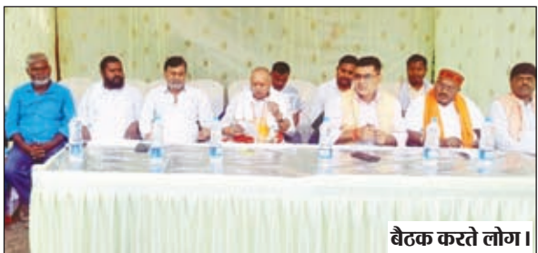
बैठक करते लोग।