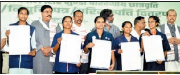
मुख्यमंत्री हेमंत सोरेन के साथ स्कॉलरशिप पाने वाले विद्यार्थी।

रांची। मुख्यमंत्री हेमंत सोरेन ने कहा कि राज्य सरकार अपने संसाधनों से झारखंड के 20 लाख आवास विहीन परिवारों को अबुआ आवास योजना के तहत तीन कमरों का पक्का मकान उपलब्ध करा रही है। सीएम ने कहा कि उनकी सरकार ने किसानों के 2 लाख रुपये तक के कृषि ऋण को माफ किया। राज्य सरकार झारखंड के बिजली उपभोक्ताओं को 200 यूनिट बिजली मुफ्त उपलब्ध करा रही है वहीं पुराने बिजली बिल को माफ भी किया गया है। यह बातें मुख्यमंत्री उन्होंने शनिवार को खेलगांव के हरिवंश टाना भगत इंडोर स्टेडियम में आयोजित मरांग गौमके जयपाल सिंह मुंडा पारदेशीय छात्रवृत्ति शिलान्यास, नियुक्ति पत्र एवं परिसंपत्ति वितरण कार्यक्रम में कही।