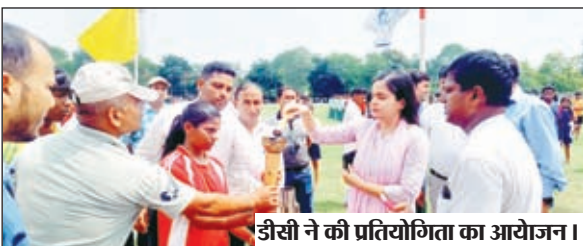
डीसी ने की प्रतियोगिता का आयोजन।