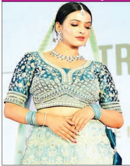
खबर मन्त्र संवाददाता

रांची। एक्सपो उत्सव के भव्य उद्घाटन के बाद राजधानी के लोगों ने बारिश के बावजूद जमकर