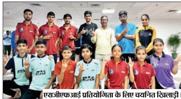
एसजीएफआई प्रतियोगिता के लिए व्यनित खिलाड़ी।

की मांग की थी। पूर्व सांसद के पहल पर ही सरकार के आदेश पर जिला प्रशासन ने सभी पीड़ितों को मुआवजा के साथ ही बर्तन, कपड़े तथा मकान की छवनी देने के पैसे निर्गत कर दिए।