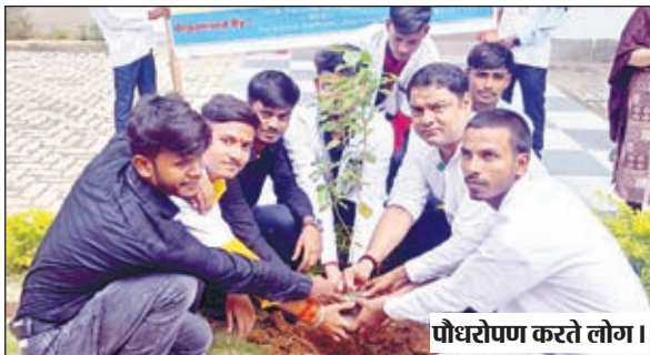
पौधरोपण करते लोग।