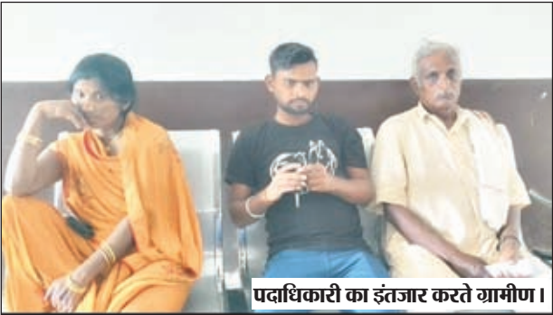
पदाधिकारी का इंतजार करते ग्रामीण।

मझिआंव। प्रखंड सह अंचल कार्यालय में पदाधिकारी से लेकर कार्यालय कर्मी तक ऑफिस खुलने के समय पर नहीं आते हैं। जिसके बाद ग्रामीण क्षेत्रों से आने वाले लोगों को परेशानियों का सामना करना पड़ता है। गुरुवार को 11 बजे तक न तो बीडीओ आये थे और न उनके कोई कर्मचारी। इसी तरह अंचल कार्यालय में भी 11 बजे तक न तो सीओ पहुंचे