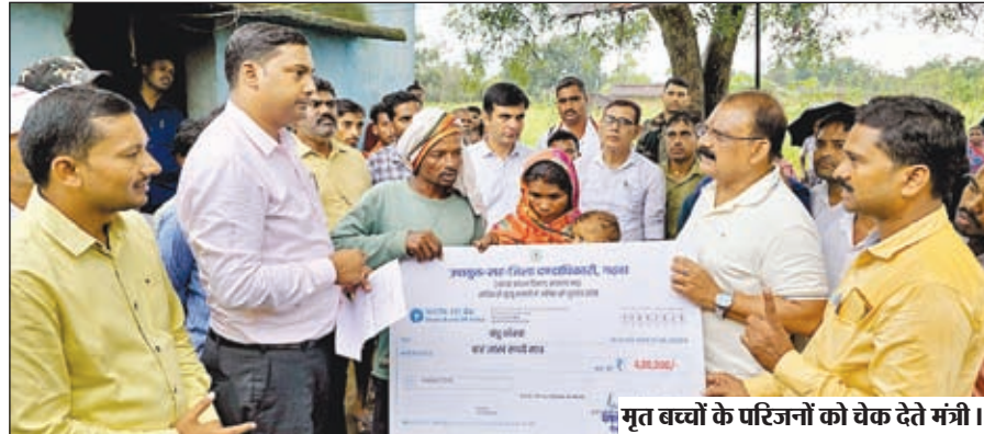
मृत बच्चों के परिजनों को चेक देते मंत्री।