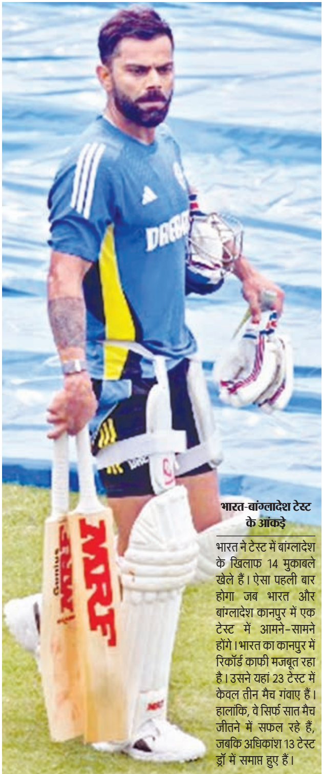
भारत-बांग्लादेश टेस्ट के आंकड़े

कानपुर। भारतीय टीम 27 सितंबर से कानपुर के ग्रीन पार्क स्टेडियम में बांग्लादेश के खिलाफ दूसरा टेस्ट मैच खेलेगी। कप्तान रोहित शर्मा की अगुवाई वाली भारतीय टीम शुक्रवार से यहां शुरू हो रहे श्रृंखला के दूसरे और अंतिम टेस्ट मैच में बांग्लादेश का सुपड़ा साफ करने के इरादे से मैदान पर उतरेगी। ग्रीनपार्क मैदान पर करीब तीन साल के अंतराल के बाद होने वाला यह टेस्ट मैच भारत के लिये न सिर्फ आइसीसी विश्व टेस्ट चैंपियनशिप में अपनी स्थिति को और मजबूत करने का अवसर होगा बल्कि नवंबर में शुरू होने वाले ऑस्ट्रेलिया दौर के लिये टीम की तैयारियों को परखने का मौका देगा। दोनों टीमों ने कानपुर पहुंचने के बाद ट्रेनिंग सेशन में हिस्सा लिया। रोहित शर्मा की अगुआई वाली भारतीय टीम ने बांग्लादेश के खिलाफ दो मैचों की टेस्ट सीरीज में 1-0 की बढ़त बना ली है। टीम इंडिया ने चेन्नई के चेपाक स्टेडियम में पहला टेस्ट 280 रनों के बड़े अंतर से जीता था। भारतीय टीम ने इस जीत के साथ विश्व टेस्ट चैंपियनशिप 2023-25 चक्र में शीर्ष स्थान पर अपनी स्थिति मजबूत कर ली है। अब दूसरा टेस्ट जीतकर टीम इंडिया बांग्लादेश को क्लीन स्वीप करने उतरेगी। कानपुर, साल 2021 के बाद पहली बार टेस्ट मैच की मेजबानी करेगा। 2021 में न्यूजीलैंड ने एक रोमांचक मुकाबले में भारत के खिलाफ ड्रॉ खेला था।