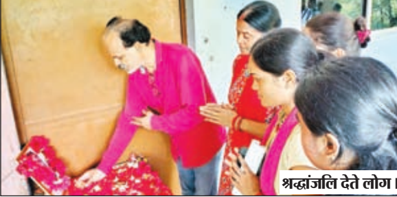
श्रद्धंजलि देते लोग।