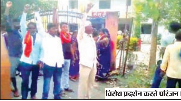
विरोध प्रदर्शन करते परिजन।