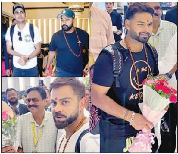
स्टेडियम पर बारी बारी से अभ्यास करेंगी। दोनों टीमों को शहर के एकमात्र तीन सितारा होटल

कानपुर। बांग्लादेश के खिलाफ 27 सितंबर से शुरू होने वाले श्रृंखला के दूसरे और आखिरी टेस्ट मैच के लिए भारतीय टीम के सदस्य मंगलवार को कानपुर पहुंचे। भारतीय टीम के सदस्य टुकड़ियों में वहां पहुंचे। सबसे पहले चकेरी हवाई अड्डे से भारतीय कोच गौतम गंभीर और विराट कोहली बाहर निकले जबकि कुछ देर बाद शुभमन गिल, रोहित शर्मा को औद्योगिक नगरी में आमन हुआ। बाद में विकेटकीपर बल्लेबाज रिषभ पंत भी कानपुर पहुंच गए। बांग्लादेश की टीम के देर शाम तक वहां पहुंचने की संभावना है। दोनों टीमों बुधवार से ऐतिहासिक ग्रीन पार्क