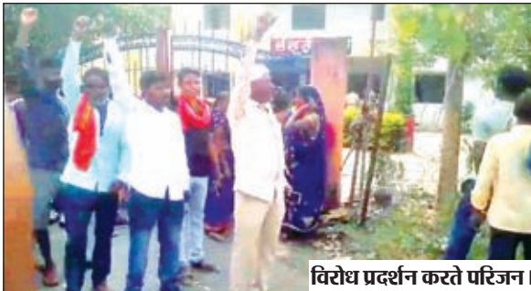
विरोध प्रदर्शन करते परिजन।