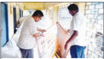
गोदाम में कबाड़ की तरह बेकार पड़ी बोर्ड।

बरवाडीह। केंद्र सरकार के माध्यम से संचालित प्रधानमंत्री गरीब कल्याण योजना की जानकारी और पारदर्शिता को लेकर सरकार के माध्यम से लगभग छह माह पूर्व बोर्ड की आपूर्ति गोदाम में की गई थी