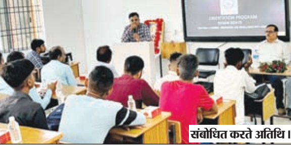
संबोधित करते अतिथि।