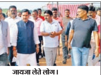
जायजा लेते लोग।

बालूमाथ। बालूमाथ में भोजपुरी स्टार सह दिल्ली के सांसद मनोज तिवारी एवं गोरखपुर सांसद रवि किशन के बालूमाथ में आज