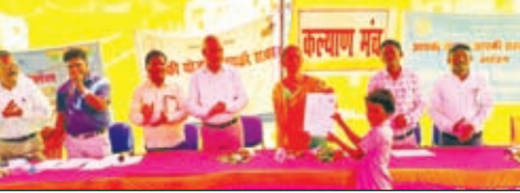
शिविर में लाभुको को स्वीकृत पत्र देती मुखिया