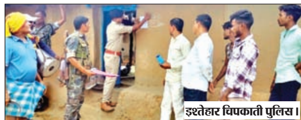
इश्टेहार चिपकाती पुलिस।

वर्षों से फरार अभियुक्त के घर पुलिस ने चिपकाया इश्टेहार