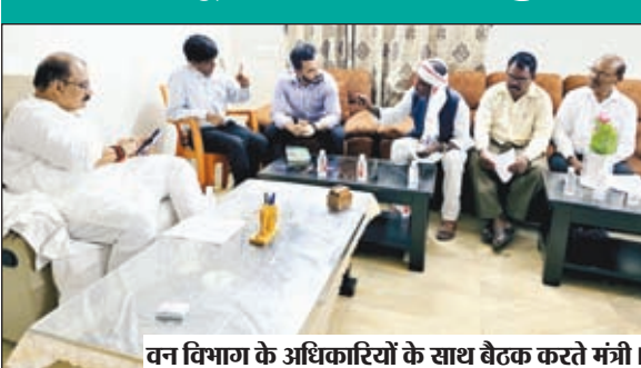
वन विभाग के अधिकारियों के साथ बैठक करते मंत्री।

बैठक में मंत्री ने मानव-हाथी संघर्ष की घटनाएं, आज तक विभाग द्वारा की गई कार्रवाई, भविष्य की कार्रवाई और संचायित समाधान, ग्रामीणों को मुआवजा की स्थिति की जानकारी लिया। मौके पर मंत्री