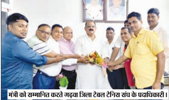
मंत्री को सम्मानित करते गढ़वा जिला टेबल टेनिस संघ के पदाधिकारी।