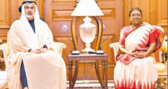
भारत की व्यापक रणनीतिक साझेदारी के अनुरूप है। राष्ट्रपति ने कहा कि दोनों देशों के दूरदर्शी नेतृत्व के कारण

नयी दिल्ली। आबू धाबी के युवराज शेख खालिद बिन मोहम्मद बिन जायद अल नाह्यान ने सोमवार को यहां राष्ट्रपति भवन में राष्ट्रपति द्रौपदी मुर्मू से मुलाकात की। श्रीमती मुर्मू ने कहा कि उन्हें संयुक्त अरब अमीरात के नेतृत्व की तीसरी पीढ़ी का राष्ट्रपति बनने में स्वागत करते हुए खुशी हो रही है। यह उच्च स्तरीय जुड़ाव की उस लंबी परंपरा को जारी रखती है जो संयुक्त अरब अमीरात के साथ