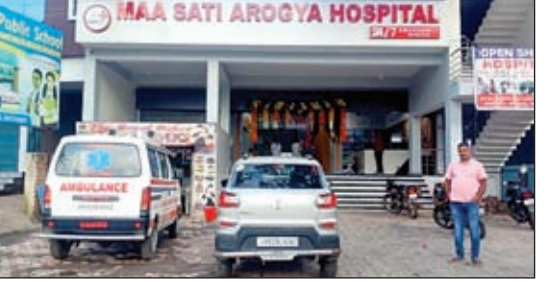
मां सती आरोग्य हॉस्पिटल