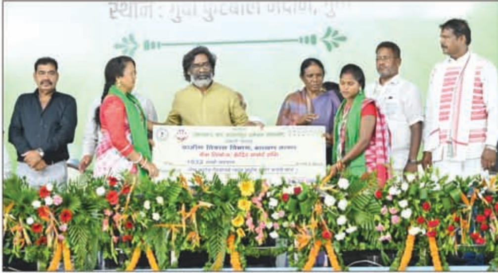
मुख्यमंत्री ने पश्चिमी सिंहभूम में कार्यक्रम के दौरान सखी मंडल को 30 करोड़ रुपये से अधिक का बैंक क्रेडिट से जोड़ा

ग्रामीण महिलाएं और अर्थव्यवस्था सशक्त हो, इसके लिए राष्ट्रीय ग्रामीण आजीविका मिशन के जरिए राज्य के 26 लाख परिवारों को आजीविका के सशक्त माध्यमों से जोड़ा गया है। कृषि, पशुपालन, वनोपज, अंडा उत्पादन, जैविक खेती आधारित आजीविका से ग्रामीण परिवारों को आच्छादित किया जा रहा है। राज्य संपोषित जोहार परियोजना के तहत 17 जिलों के 68