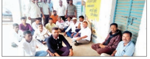
बैठक में शामिल लोग