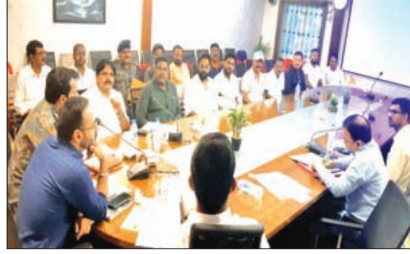
बैठक करते डीसी

को लेकर बेहद सतर्क रहने की आवश्यकता है। यह बहुत संवेदनशील परिस्थिति है जिसमें परीक्षा को लेकर किसी भी प्रकार की गड़बड़ी फैलानेवालों पर पैनी नजर रखने की आवश्यकता है। होटल संचालक इन दो दिनों के दौरान अपने होटल व होटल परिसर में किसी भी सदिग्ध व्यक्ति के होने की सूचना त्वरित रूप से जिला प्रशासन को दें। आपके होटल में कौन आ रहे हैं इसकी व्यक्तिगत रूप से रूचि लेते हुए अपने पास जानकारी रखें। पुलिस अधीक्षक