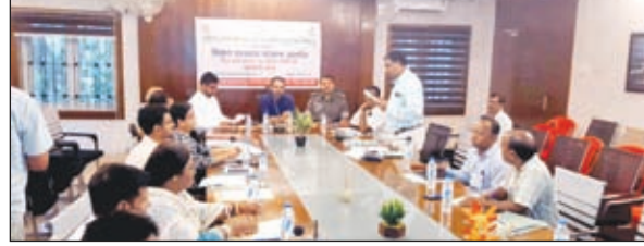
बैठक में मौजूद अधिकारी

लोहरदगा। मिशन वात्सल्य अंतर्गत बाल कल्याण एवं संरक्षण समिति की जिला स्तरीय बैठक उपायुक्त डॉ वाघमारे प्रसाद कृष्ण की अध्यक्षता में आयोजित हुई। बैठक में बाल संरक्षण, समाज कल्याण, श्रम, डालसा, शिक्षा, मिरकल फाउंडेशन, शा आदि की ओर जिला में बाल संरक्षण व पुनर्वास की दिशा में किये जा रहे कार्यों से अवगत कराया गया और विभिन्न विभागों के द्वारा इस दिशा में किये जाने वाले कार्यों व आपसी समन्वय से किये जाने वाले कार्यों की जानकारी दी गयी। उपायुक्त द्वारा सभी विभागों को आपसी समन्वय से बच्चों के हित में किये जाने वाले कार्यों में प्रगति लाने का निर्देश दिया। पुलिस अधीक्षक हारिस बिन जमा द्वारा पोस्को एक्ट में आ रहे मामलों व उनकी सुनवाई और सजा के प्रावधानों के बारे बताया गया। साथ ही उन्होंने कहा कि तय समय-सीमा के अंदर ही कार्रवाई की जा रही है। पुलिस अधीक्षक ने कहा कि श्रम विभाग पुलिस विभाग के साथ मिलकर संयुक्त कार्रवाई करे। उच विकास आयुक्त दिलीप प्रताप सिंह शेखावत ने कहा कि जो भी निर्देश दिए गए हैं उनका अक्षरशः पालन किया जाय। जो भी मामले आए उनको मॉनिटरिंग की जाय। डालसा