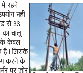
बिजली बनाने कर्मी।

हिटर और समरसेबल का उपयोग नहीं कर पा रहे हैं। बताते चले की रेहला ग्रिड से 33 हजार केपी की बिजली सप्लाई तो सेल का चालू है। परंतु सेल परिसर में पुराने बिजली के केबल और ट्रांसफार्मर बिलकुल जर्जर हो चुके हैं। जिसके कारण हिटर और समरसेबल के उपयोग करने के कारण उक्त बिजली केबल और ट्रांसफार्मर पर जोर पड़ने के कारण बराबर शॉर्ट सर्किट की समस्या होने से बिजली बाधित हो जा रही है। अभी वर्तमान में भवनाथपुर चुना पथर खदान सेल को हेड कार्यालय से अतिरिक्त फंड राशि नहीं मिलने के कारण किसी तरह बिजली विभाग के द्वारा मरमती से बिजली सेवा बहाल है। सेल के बिजली कर्मियों ने बताया की अगर सेल परिसर में रहने वाले लोग खाना बनाने के लिए हिटर और पानी के लिए समरसेबल का उपयोग पूर्णतः बंद नहीं करते है तो ऐसे में कभी भी बिजली सेवा लंबे समय के लिए बंद हो सकती है।