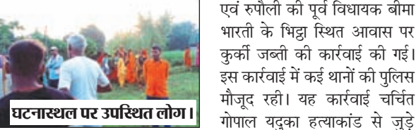
घटनास्थल पर उपस्थित लोग।