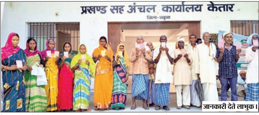
जानकारी देते लामुक।