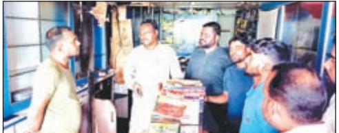
आग लगी की जानकारी देते मोबाइल दुकान के मालिक

कारण दुकान में आग लगी थी। उन्होंने बताया कि हम लोग जब भी दुकान बंद करते हैं तो दुकान का बिजली एवं इनवर्टर का कनेक्शन काट दिया जाता है। इसलिए ऐसा प्रतीत होता है कि मोबाइल की बैटरी ब्लास्ट होने के कारण ही दुकान में आग लगी होगी।