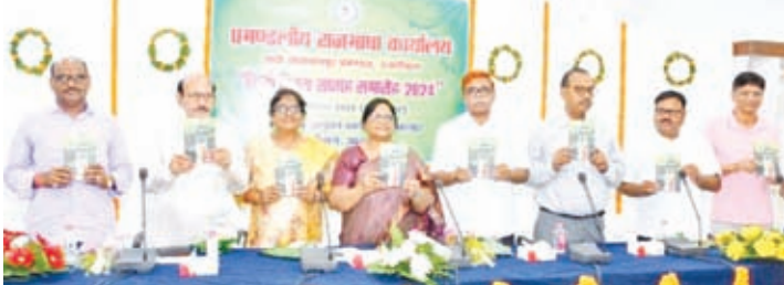
पुस्तक गुड़िया तो बहुते मुट्ठस है का विमोचन करते आयुक्त व अन्य।

हजारीबाग। हिंदी न सिर्फ हमारी आधिकारिक भाषा है बल्कि यह सभी भारतवासियों के लिए अस्मिता का प्रतीक है। हम सब प्रत्येक वर्ष 14 सितंबर को हिंदी दिवस के रूप में मनाते हैं। हम सभी के जीवन में हिंदी का खास महत्व है, किसी ने हिंदी में बोलने की शुरुआत की तो किसी ने हिंदी का माहौल न होते हुए भी पूरी लगन और मेहनत से उसे सीखा। आज भारत ही नहीं बल्कि पूरा विश्व हिंदी के प्रति प्रेम दिखा रहा है जिसे आप सोशल मीडिया में भी देखते होंगे। आज हिंदुस्तान की नहीं बल्कि फिजी, अमेरिका, नाइजीरिया और चीन जैसे देश के लोग भी हिंदी को धाराप्रवाह तरीके से बोलते हैं। साथ ही उन्हें हिंदी बेहद पसंद आ रही है हमें हमेशा याद रखना चाहिए कि हमारा देश कविताओं का देश है और यही कारण है कि हिंदी आज राजभाषा है जो हमारी एकता और अखंडता