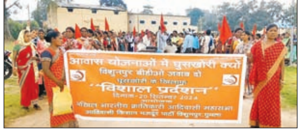
प्रखंड कार्यालय के समक्ष धरना करते लोग