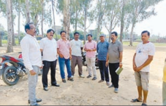
तैयारियों का जायजा लेने पहुंचे भाजपा के पदाधिकारी