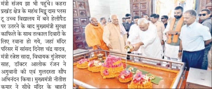
अनावरण किया साथ ही गर्भगृह में वैदिक मंत्रोच्चार के बीच पूजा

सहरसा। जिले के कहरा प्रखंड अंतर्गत अति प्राचीन दिवारी स्थित बिषहरा भगवती मंदिर का शुक्रवार को मुख्यमंत्री ने उद्घाटन किया। इस अवसर पर सुरक्षा की चाक चौबंद व्यवस्था की गई थी। मुख्यमंत्री अपने निधार्ित समय से थोड़ा पूर्व ही मंदिर पहुंचे। वे मंदिर में लगभग 15 मिनट रुकने के बाद अमरपुर के लिए रवाना हो गये। उनके साथ उप मुख्यमंत्री स्मार्ट चौधरी, केंद्रीय