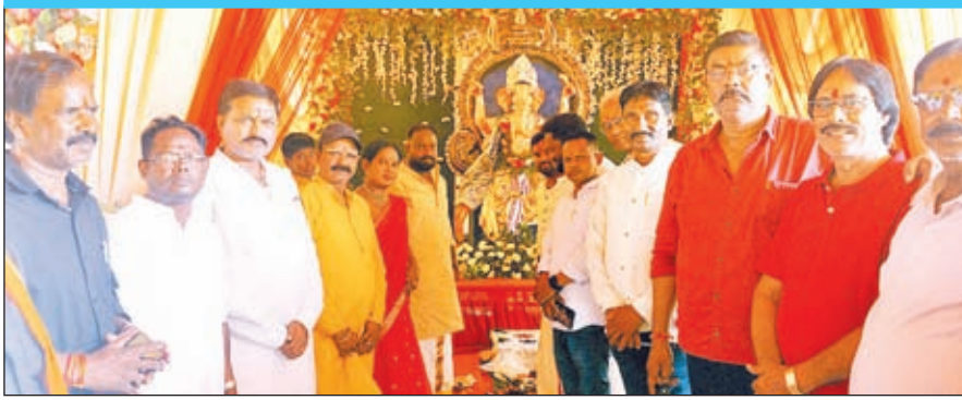
भगवान गणेश की प्रतिमा के साथ अतिथि व अन्य ।

ओरमांडी। गणेश चतुर्थी के अवसर ओरमांडी प्रखंड के विभिन्न पूजा पंडालों में भगवान गणपति की प्रतिमा स्थापित कर धूमधाम से पूजा किया गया। भगवान गणेश का पट खुलते ही पूजा पंडालों में भक्तों में भीड़ उमड़ पड़ी। वहीं पूजा पंडालों में भगवान गणेश की भक्ति गाने व गणपति बाप्पा मोरिया की जयकारा गुंजयमान रहा। ओरमांडी में स्थापित पूजा पंडाल का उद्घाटन मुख्य अतिथि पूर्व प्रमुख