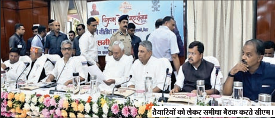
तैयारियों को लेकर समीक्षा बैठक करते सीएम।