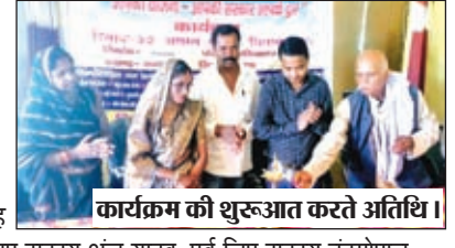
कार्यक्रम की शुरूआत करते अतिथि।

सगमा। प्रखंड के घघरी पंचायत सचिवालय में शनिवार को आपकी योजना, आपकी सरकार, आपके द्वार कार्यक्रम का आयोजन किया गया। बीडीओ सह