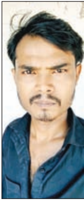
मृतकों की फाइल फोटो और शो संतप्त परिवार।