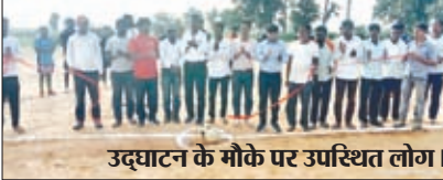
उद्घाटन के मौके पर उपस्थित लोग ।

चंदवा। प्रखंड के जमीरा पंचायत अंतर्गत रखी ग्राम स्थित सरना खेल मैदान में आयोजित प्रतिभा खोज फुटबॉल