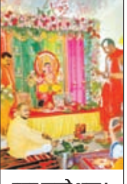
पूजा करते भक्त ।