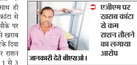
एजीएम पर खराब कांटा से कम राशन तौलने का लगाया आरोप