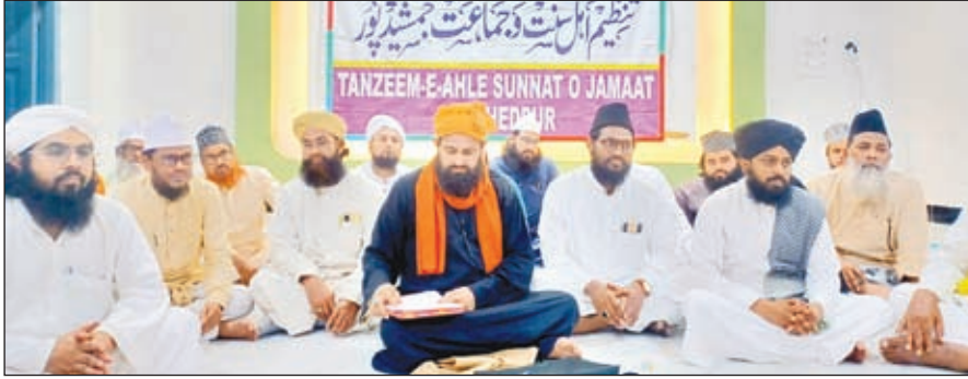
घातकीडीह में तैयारी बैठक करते मौलानागण।

बैठक में पैगंबर ए इस्लाम की याद में शानदार और भव्य मोतहदा जुलूस-ए-मोहम्मदी