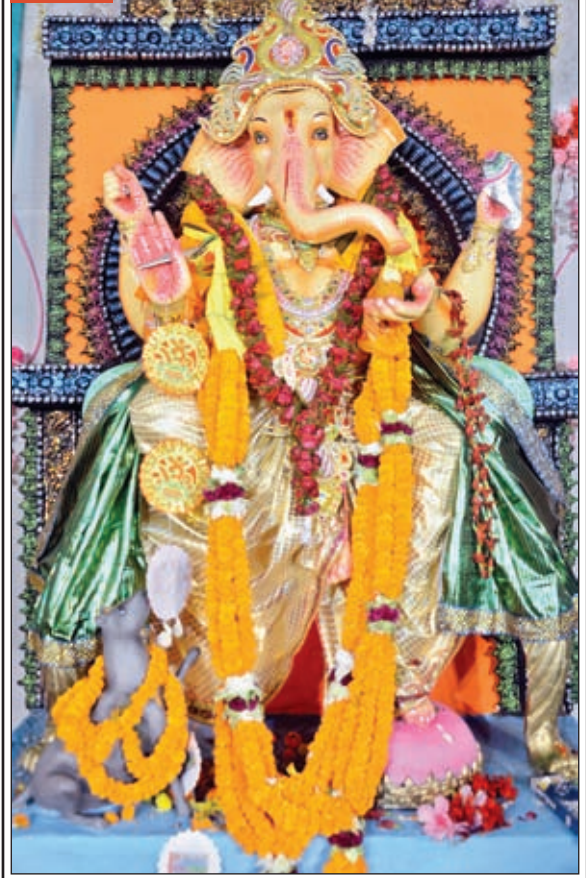
रांची। झारखंड समेत देशभर में श्री गणेश चतुर्थी की धूम है। सिद्धि विनायक भगवान गणेश की पूजा-अर्चना धूमधाम से की जा रही है। इन्हें विघ्नहर्ता और सुखकर्ता के रूप में भी जाना जाता है।