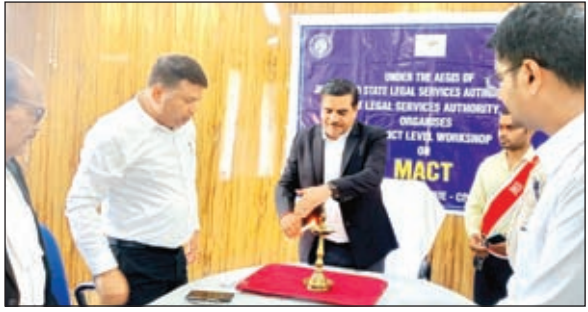
कार्यशाला का उद्घाटन करते जिला एवं स्त्र न्यायाधीश