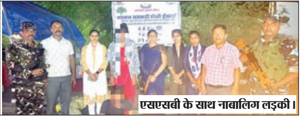
एसएसबी के साथ नाबालिग लड़की।

पूर्वी चंपारण। भारत-नेपाल सीमा की सुरक्षा में तैनात एसएसबी 47वीं वाहिनी की मानव तस्करी रोधी ईकाई के जवानों ने शनिवार को मैत्री पुल से एक राजस्थान की नाबालिग लड़की को रेस्क्यू करते हुए उसे मानव तस्करी की चंगुल से मुक्त कराया है। बताया गया है, कि उक्त लड़की मानव तस्करी के चंगुल में फंसकर राजस्थान से नेपाल जा रही थी इस मामले में नाबालिग लड़की को बरामद करते हुए आरोपी मानव तस्करी युवक को हरया थाना को सौंप दिया गया है। इसकी जानकारी देते हुए एसएसबी मानव तस्करी रोधी ईकाई के निरीक्षक सीआर बेनीवाल ने बताया कि लड़के ने पहले लड़की को सोशल मीडिया के माध्यम से प्रेम के जाल में फंसाया और इसके बाद राजस्थान से इसे नेपाल लेकर जा रहा था, लेकिन उससे पहले ही इसकी गिरफ्तारी रवसील बॉर्डर पर कर ली गयी। दोनों राजस्थान के झुंनुझ जिला के रहने वाले हैं। इधर, लड़की के अपहरण को लेकर इसके परिजनों ने राजस्थान में भी मामला दर्ज कराया है। वहीं इसको लेकर हरया थाना में प्राथमिकी दर्ज करते हुए आरोपी युवक को न्यायिक हिरासत में भेज दिया गया है। जबकि नाबालिग लड़की को भी बालिका गृह में रखा गया है। साथ ही नाबालिग लड़की के परिजनों को भी इसकी जानकारी दे दी गयी है। इस पूरे अभियान में एसएसबी मानव तस्करी रोधी ईकाई के साथ-साथ प्रयास जुबेनाइल सेंटर पूर्वी चंपारण शामिल थे।