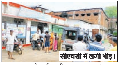
सीएचसी में लगी भीड़।