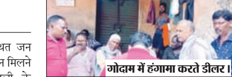
गोदाम में हंगामा करते डीलर ।