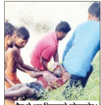
डैम से शव निकालते गोताखोर ।