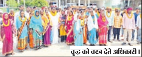
वृद्ध को वरदा देते अधिकारी ।