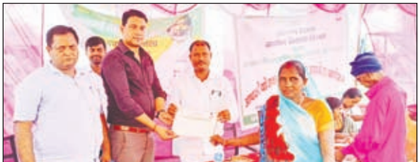
प्रमाण पत्र वितरण करते अतिथि।