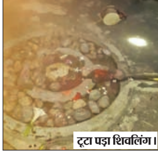
टूटा पड़ा शिवलिंग।