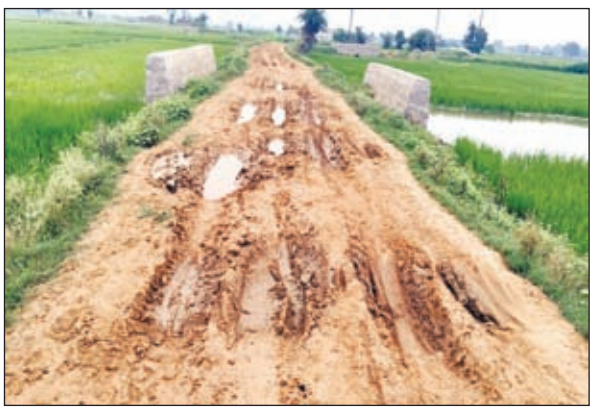
रोड की नरकीय स्थिति