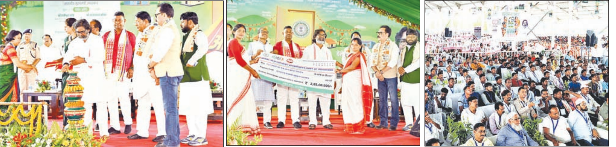
सरकार आपके द्वार कार्यक्रम का शुभारंभ करते मुख्यमंत्री हेमंत सोरेन। लाधुको को योजना का लाभ प्रदान करते मुख्यमंत्री। कार्यक्रम में शामिल लोग।

हेमंत ने कहा, हेडक्वाटर से सरकार न चले इसलिए बनी सरकार आपके द्वार कार्यक्रम, झारखंड से विपक्षी दलों को बाहर खदेड़ने का कार्यक्रम में भरा दंभ