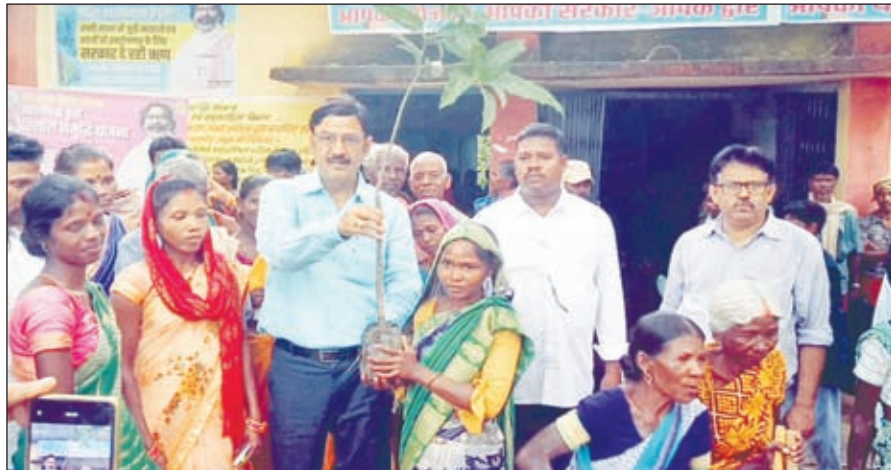
ग्रामीणों को आम का पौधा वितरण करते हुए डीडीसी

इस अवसर पर उप विकास आयुक्त ने उपस्थित ग्रामीणों को संबोधित करते हुए कहा कि सरकार आपके द्वार कार्यक्रम का उद्देश्य जनता की समस्याओं को राख लेने की अहम पहल करना है। उन्होंने कहा कि सरकार की विभिन्न योजनाओं का लाभ अब ग्रामीणों को त्वरित रूप से दिया