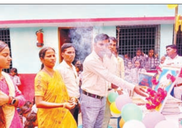
कार्यक्रम में उपस्थित लोग

खबर मन्त्र संवाददाता डंडई। डंडई प्रखंड क्षेत्र के सरकारी गैर सरकारी, निजी विद्यालय, शिक्षण संस्थानों में शिक्षक दिवस के अवसर पर सर्वपल्ली डॉ राधाकृष्णन की जयंती मनाया गया। शिक्षक दिवस के अवसर पर शिक्षकों के सम्मान में विभिन्न विद्यालयों में अलग अलग तरह के कार्यक्रम आयोजित किए गए।