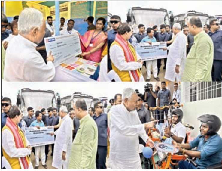
विकास कार्यों का निरीक्षण के दौरान कई योजनाओं का शिलान्यास एंड उद्घाटन करते हुए सीएम, बल्लोटापुर में कई योजनाओं का शिलान्यास एंड उद्घाटन के दौरान जीविका दीदी से बात करते हुए