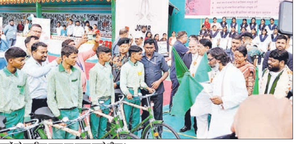
बच्चों को साइकिल प्रदान कर रवाना करते सीएम। कमान संभालते ही सीएम ने राज्यवासियों का कल्याण करना किया आरंभ : भोक्ता

● कोरोना वैक्सीनेशन में झारखंड के लोगों के साथ साजिश करने का लगाया आरोप