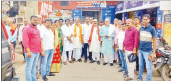
बैठक में उपस्थित कार्यकर्ता ।