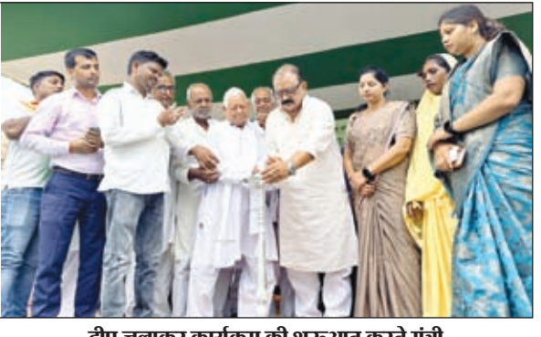
दीप जलाकर कार्यक्रम की शुरुआत करते मंत्री