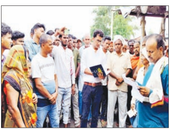
जांच करते पदाधिकारी