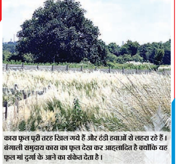
कास फूल पूरी तरह खिल गये हैं और ठंडी हवाओं से लहरा रहे हैं। बंगाली समुदाय कास का फूल देख कर आह्लादित है क्योंकि यह फूल मां दुर्गा के आने का संकेत देता है।