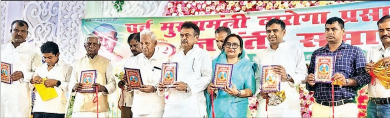
पूर्व मंत्री चंद्रिका राय पूर्व मुख्यमंत्री दारोगा प्रसाद राय के 102वीं जयंती पर स्मारिका का विमोचन करते

अंतिम सूची का प्रकाशन किया जाएगा। जिला परिवहन पदाधिकारी ने कहा कि यह योजना परिवहन सेवाओं को बेहतर बनाने और लोगों को सुविधा प्रदान करने के लिए शुरू की गई है। उन्होंने सभी संबंधित पक्षों से सहयोग करने और योजना को सफल बनाने की अपील की है।