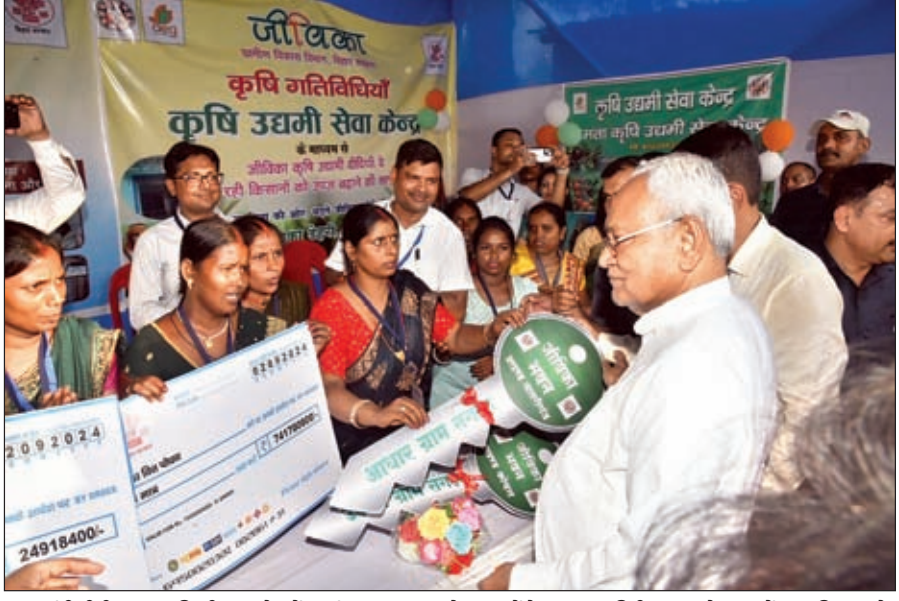
मुख्यमंत्री नीतिश कुमार डिहरी ऑनसोन में स्वयं सहायता समूह के सदस्यों के स्टॉल का निरीक्षण करते एवं उन्हें सम्मानित करते