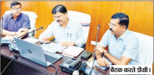
बैठक करते डीसी।