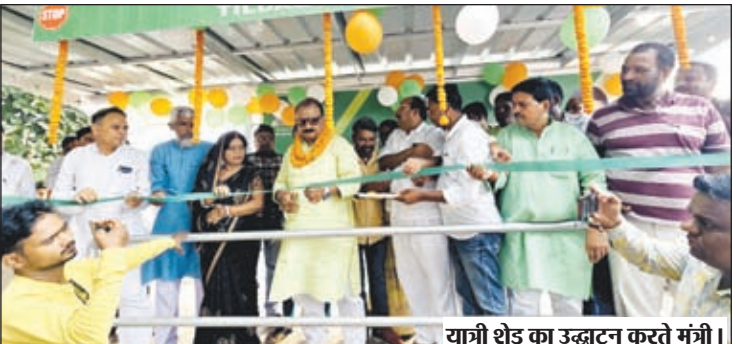
यात्री शेड का उद्घाटन करते मंत्री।