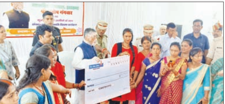
सखी मंडलों के बीच 57 लाख का चेक वितरण करते