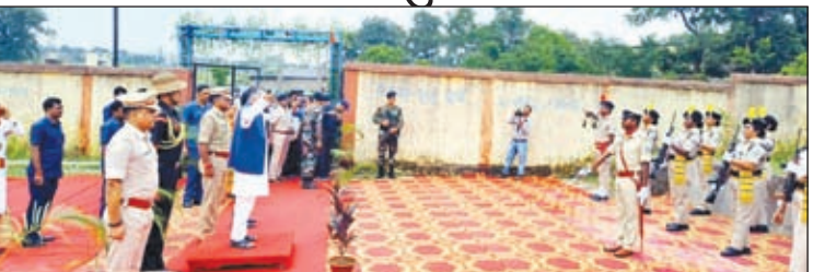
राज्यपाल को गार्ड ऑफ ऑनर देते पुलिस के जवान