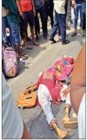
दुर्घटना में मृत

9 माह के बच्चे और महिला की मौत, आक्रोशित लोगों ने किया सड़क जाम