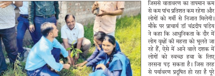
पौधा लगाते लोग

के द्वारा बताया गया कि पौधा की कमी के कारण समय पर मानसून नहीं आ रहा है। सार्वजनिक जगहों पर इस तरह के पौधे लगाए जाएंगे