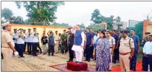
माननीय राज्यपाल व अन्य

मारसल प्राथमिक बुनकर सहयोग समिति उत्पादक केन्द्र, पंचायत-बहेरा, प्रखंड-चुरचू, हजारीबाग में बुनकर सहयोग समिति के सदस्यों के साथ राज्यपाल ने किया संवाद