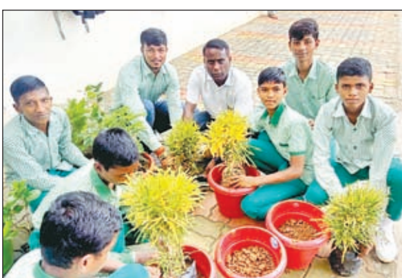
पौधारोपण करते अधिकारी