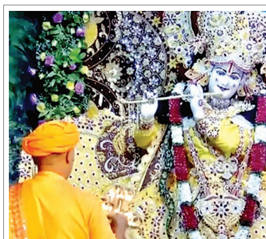
मथुरा के भागवत भवन मंदिर में सोमवार को पूजन-अर्चना करते यूपी के सीएम योगी आदित्यनाथ।