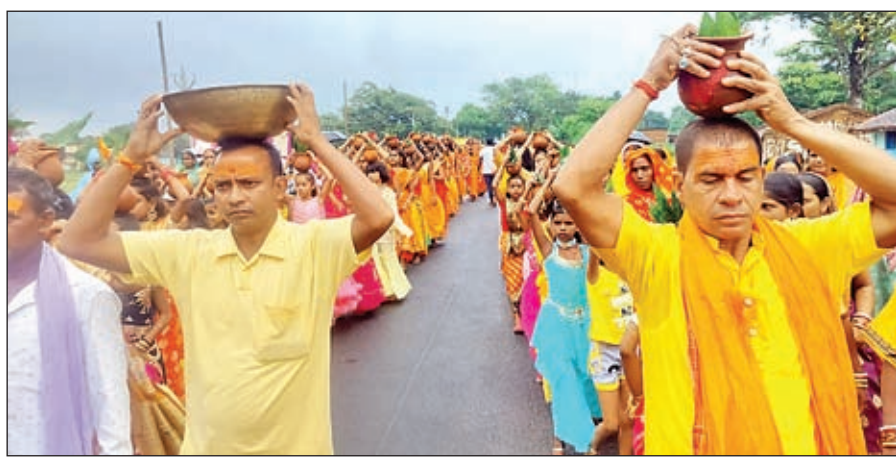
कलश यात्रा में शामिल महिलाएं एवं पुरुष