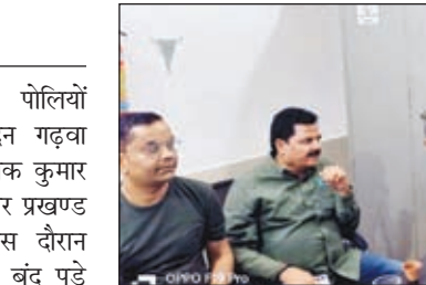
जानकारी लेते सीएस।