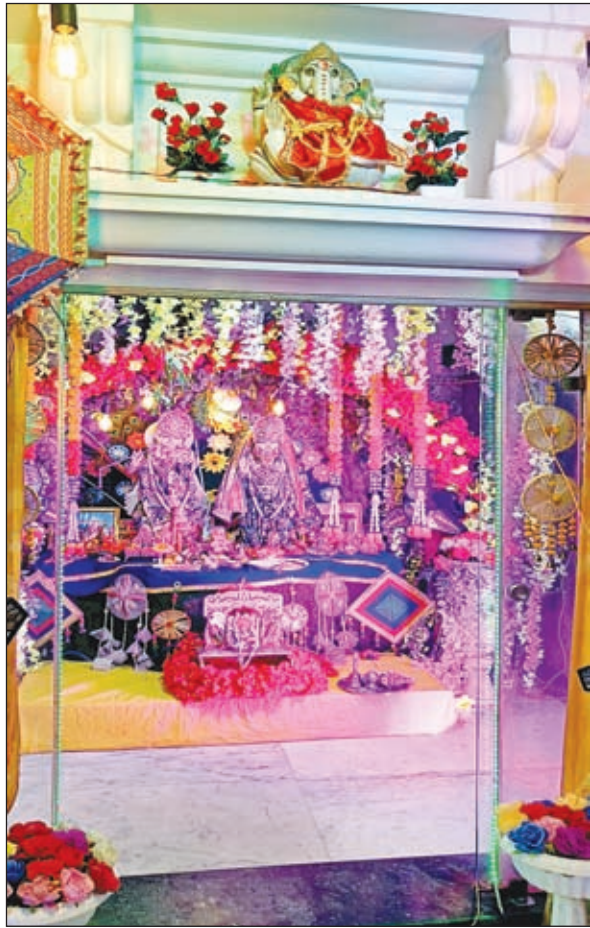
राधा-कृष्ण की प्रतिमा