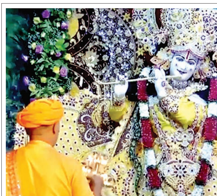
मथुरा के भागवत भवन मंदिर में सोमवार को पूजन-अर्चना करते युपी के सीएम योगी आदित्यनाथ।

रायपुर। कांग्रेस शासन काल में हुए पंद्रह हजार करोड़ रुपये के महादेव सट्टेबाजी ऐप घोटाले की जांच सीबीआई करेगी। यह जानकारी सोमवार को प्रदेश के उपमुख्यमंत्री और गृहमंत्री विजय शर्मा ने दी है। उन्होंने बताया कि इसकी अधिसूचना जारी कर दी गई है। इस मामले में अब तक ईडी ने 11 लोगों को गिरफ्तार किया है। उपमुख्यमंत्री और गृहमंत्री विजय शर्मा ने उक्त जानकारी देते हुए बताया कि महादेव घोटाले से संबंधित 70 मामलों राज्य के विभिन्न पुलिस थानों में और एक मामला आर्थिक अपराध अन्वेषण शाखा में दर्ज किया गया था। हमने इन सभी मामलों को सीबीआई को सौंपने का फैसला किया है और इस संबंध में एक अधिसूचना जारी की गई है। उन्होंने कहा कि महादेव सट्टेबाजी ऐप घोटाला केवल एक राज्य के बजाय कई राज्यों का मामला बन गया है। ऐसा कहा जाता है कि कश्चित्त घोटाले के कुछ सरनाम विदेश में रहते है।