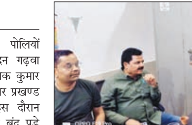
जानकारी लेते सीएस।