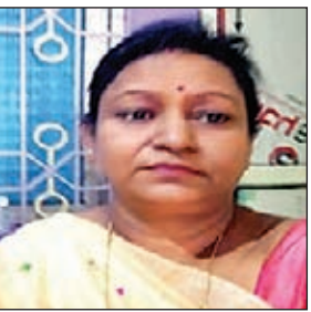
आवास में उन्हें हार्ट अटैक आया था। जिसके बाद उन्हें तत्काल

■ लातेहार में जिला शिक्षा पदाधिकारी के पद पर कर चुकी है कार्य