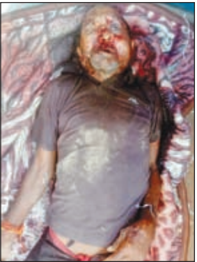
पोस्टमार्टम के लिए भेज दिया।