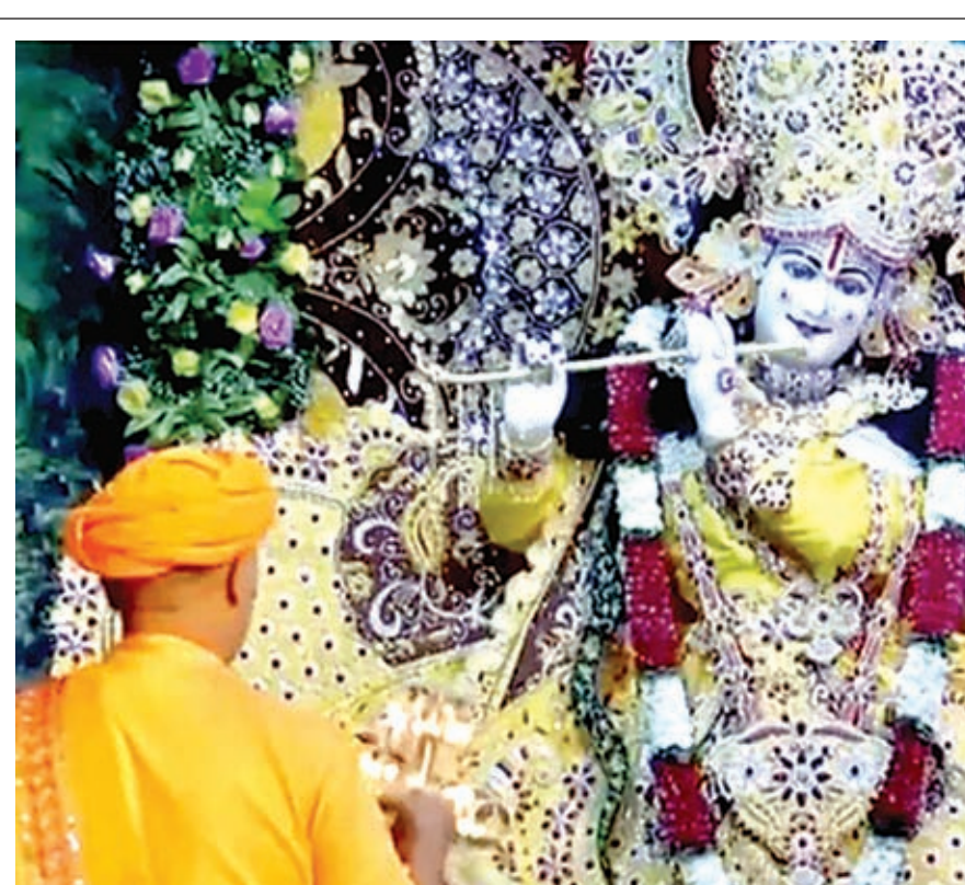
मथुरा के भागवत भवन मंदिर में सोमवार को पूजन-अर्चना करते यूपी के सीएम योगी आदित्यनाथ।