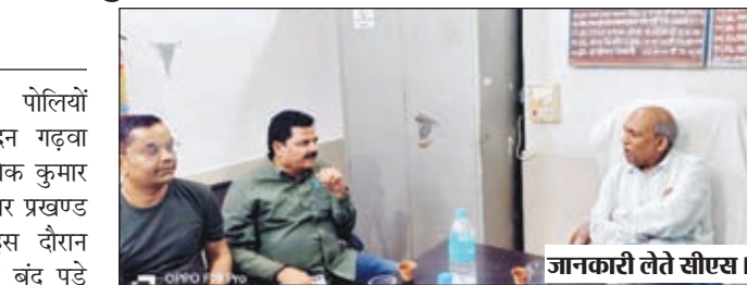
जानकारी लेते सीएस।