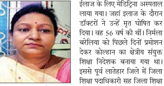
आवास में उन्हें हार्ट अटैक आया था। जिसके बाद उन्हें तत्काल