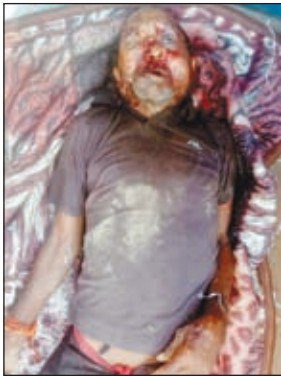
पोस्टमार्टम के लिए भेज दिया।