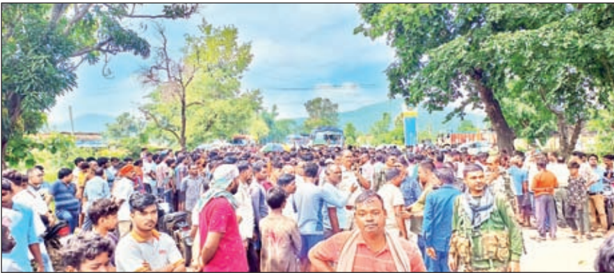
जामकर्ताओं द्वारा किया गया सड़क जाम व समझाते प्रशासन

मृतक के परिजनों ने अधिकारियों से मृतक के परिवार को उचित मुआवजा देने एवं पूरे मामले की जांच हत्या के दृष्टिकोण से करने की मांग की। इसके बाद