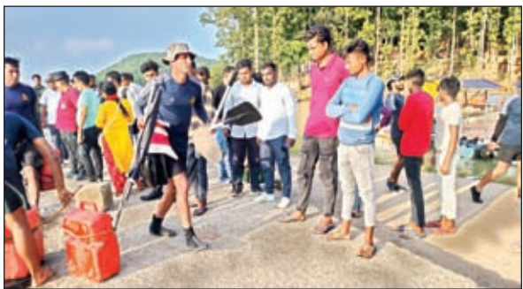
स्रोत अभियान पूर्ण कर सोनार एवं अन्य उपकरण लेकर बोट से उतरते इंडियन नेवी के विशेषज्ञ।