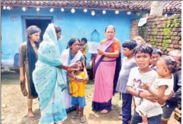
पोलियो की दवा पिलाने स्वास्थ्य कर्मी