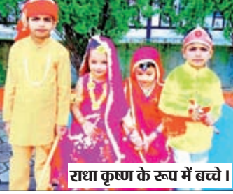
राधा कृष्ण के रूप में बच्चे।

भवनाथपुर। प्रखंड के डीएवी विद्यालय में जन्माष्टमी महोत्सव को लेकर राधा कृष्ण बाल रूप सज्जा प्रतियोगिता का आयोजन किया गया। जिसमें नन्हें मुहें बच्चों ने पूरे उत्साह के साथ भाग लिया और एक से बढ़कर एक राधा कृष्ण के मनमोहक रूप को धारण किया। बच्चों ने विद्यालय रैंप पर मनमोहक रूप सज्जा में आकर अलग-अलग भावों को दिखाया और उपस्थित अभिभावकों को मंत्रमुग्ध कर दिया। माता-पिता अपने बच्चों को राधा कृष्ण के रूप में देखकर अत्यंत खुश हुए और विद्यालय के इस