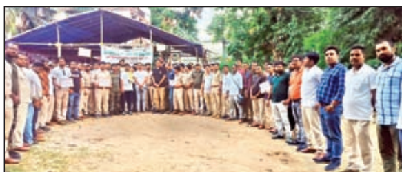
प्रदर्शन में शामिल वनरक्षी