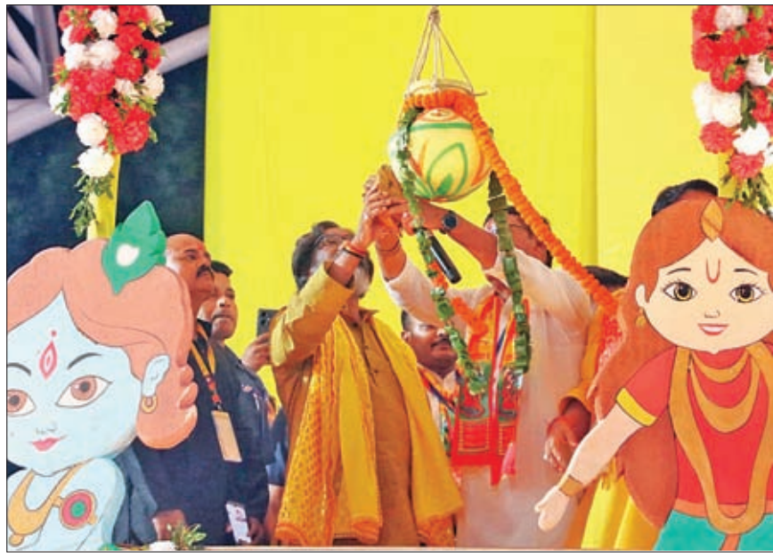
श्रीकृष्ण जन्मोत्सव आयोजन समिति के द्वारा आयोजित श्रीकृष्ण जन्माष्टमी महोत्सव के दूसरे दिन राविवार को मोरारबादी मैदान में दही-हांडी प्रतियोगिता में जा कर बच्चों का हासला बढ़ाते सीएम हेमंत सोरेन