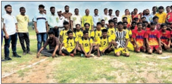
उद्घाटन के मौके पर खिलाड़ियों के साथ अतिथि