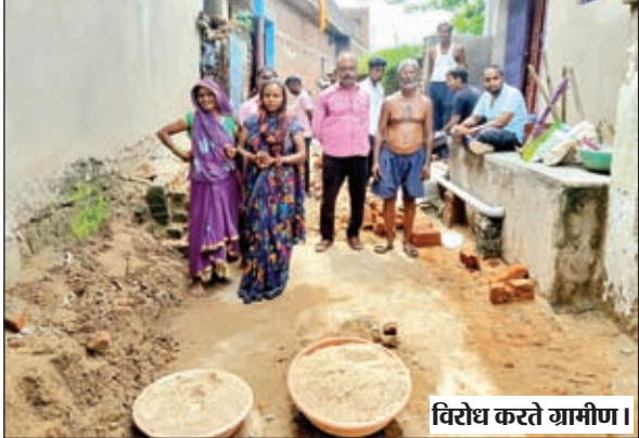
विरोध करते ग्रामीण।