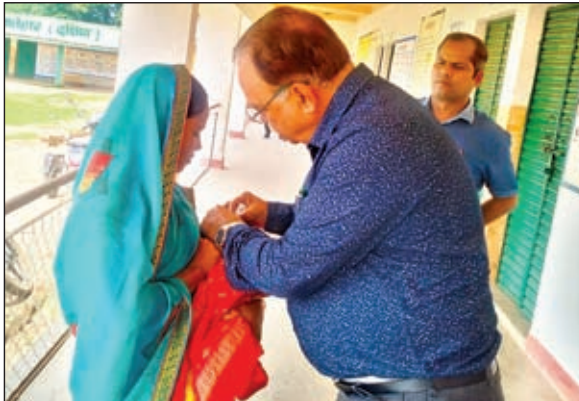
पोलियो की खुराक पिलाकर अभियान की शुरुआत करते अतिथि