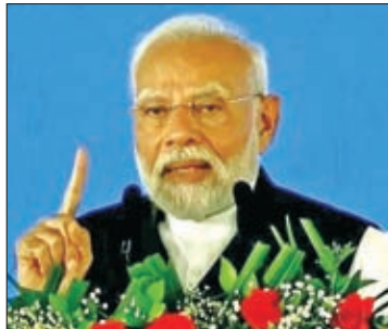
सरकार कानूनों को भी लगातार सख्त कर रही है। महासम्मेलन में पीएम मोदी ने महिला

नयी दिल्ली (एजेंसी)। महाराष्ट्र के जलगांव में लखपति दीदी सम्मेलन में पीएम मोदी ने कोलकाता में हुई घटना के बीच कहा, महिलाओं के खिलाफ अपराध अक्षम्य पाप है। दोषी कोई भी हो, वो बचना नहीं चाहिए। उसको किसी भी रूप में मदद करने वाले बचने नहीं चाहिए। हर हाल में कड़ी से कड़ी सजा मिलेगी। अस्पताल हो, स्कूल हो, दफ्तर हो या फिर पुलिस व्यवस्था... जिस भी स्तर पर लापरवाही होती है सबका हिसाब होगा। महिलाओं पर अत्याचार करने वालों को कड़ी से कड़ी सजा देने के लिए हमारी