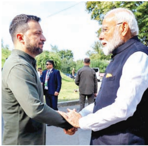
कीव में प्रधानमंत्री मोदी का स्वागत करते यूक्रेन राष्ट्रपति जेलेन्स्की।

मोदी ने कहा कि आज जब मैंने बच्चों की स्मृति में बनाए उस म्यूजियम को आपके साथ देखा, श्रद्धा सुमन अर्पित किया तो मेरा मन भरा हुआ था। दिल को गहरी चोट पहुंची हुई थी। मुझे लगता है कि युद्ध में सबसे ज्यादा निर्दोष बच्चे ही प्रभावित होते हैं, ये बहुत दर्दनाक है। इस प्रकार की घटनाएं कर्तव्य स्वीकार नहीं हो सकती। दुनिया में कोई भी मानवीय मूल पर विश्वास करने वाला व्यक्ति इसको