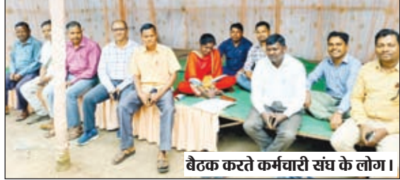
बैठक करते कर्मचारी संघ के लोग।