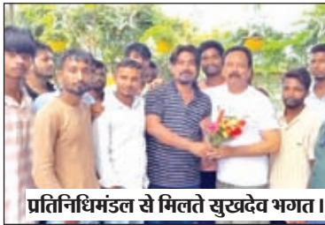
प्रतिनिधिमंडल से मिलते सुखदेव भगत।

लोहरदगा। जिला एनएसयूआई का एक प्रतिनिधिमंडल शुक्रवार को लोहरदगा लोकसभा के सांसद सुखदेव भगत के