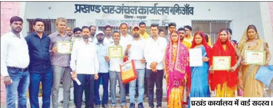
प्रखंड कार्यालय में वार्ड सदस्य।