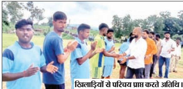
खिल्लाड़ियों से परियत्र प्राप्त करते अतिथि।