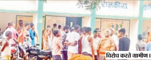
विरोध करते ग्रामीण।