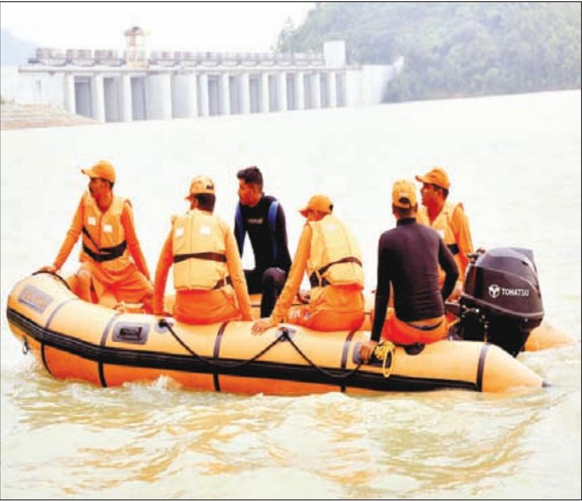
घंटों तलाशी अभियान चलाने के बाद चांडिल डैम से वापस लौटती एनडीआरएफ की टीम।