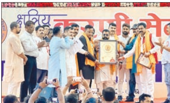
समापन समारोह के मौके पर स्मृति चिह्न देते करणी सेना के लोग।