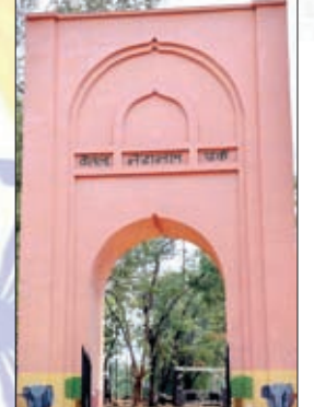
शंकर पासवान वन क्षेत्र पदाधिकारी बेतला