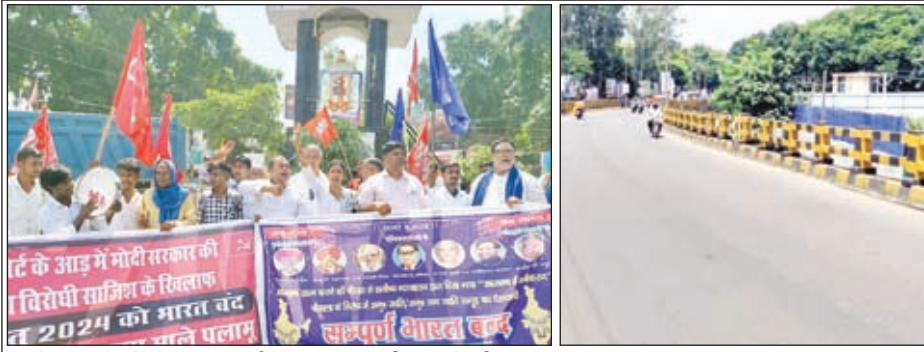
बंद के समर्थन में सड़क पर उतरे बंद समर्थक और बंद के दौरान सूनाखान पड़ी सड़क।

मेदिनीनगर। भारत बंदी का व्यापक असर पलामू जिले में देखा गया। बंद के कारण लंबी दूरी के कोई भी सवारी वाहन नहीं चला। जिस कारण यात्री भटकते नजर आये। वहीं दूसरी ओर बंद का असर पलामू जिले के व्यापारिक प्रतिष्ठानों पर भी काफी असर रहा। इक्का दुकान दुकान को छोड़कर अधिकांश दुकानें एवं व्यापारिक प्रतिष्ठान बंद रहे। बंद समर्थक सुबह से ही हाथों में झंडा बैनर लेकर बंद कराने सड़क पर