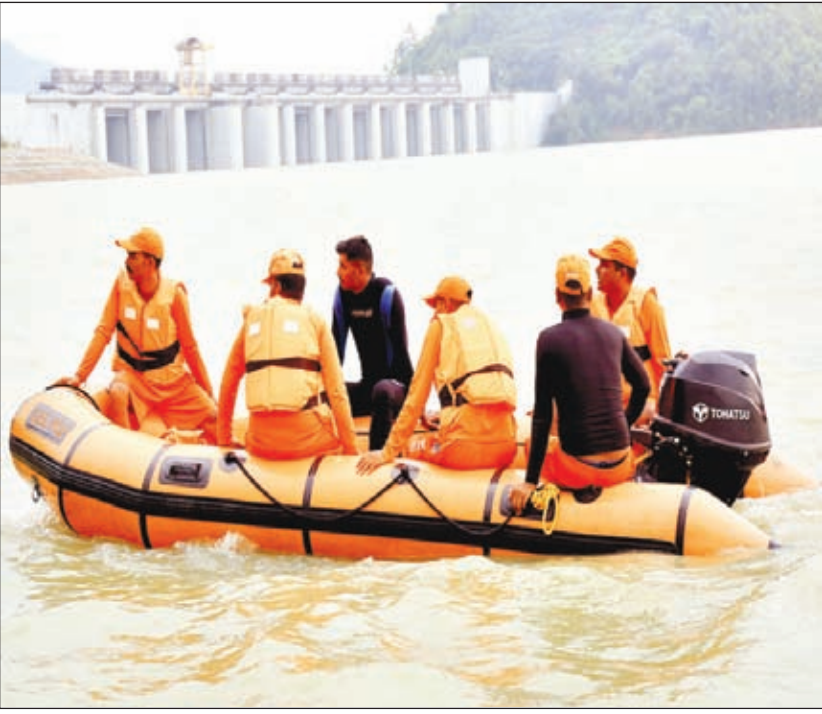
घंटों तलाशी अभियान चलाने के बाद चांडिल डैम से वापस लौटती एनडीआरएफ की टीम।