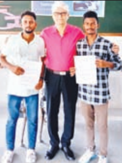
कॉलेज के चेयरमैन के साथ वर्यनित छात्र।