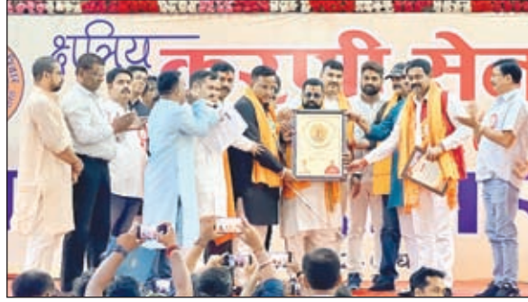
समापन समारोह के मौके पर स्मृति चिह्न देते करणी सेना के लोग।