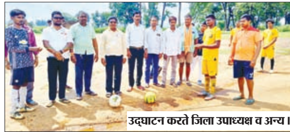
उद्घाटन करते जिला उपाध्यक्ष व अन्य।

ज्ञामुमो जिला उपाध्यक्ष ने रखी में किया फुटबॉल टूर्नामेंट का उद्घाटन