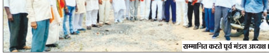
सम्मानित करते पूर्व मंडल अध्यक्ष।