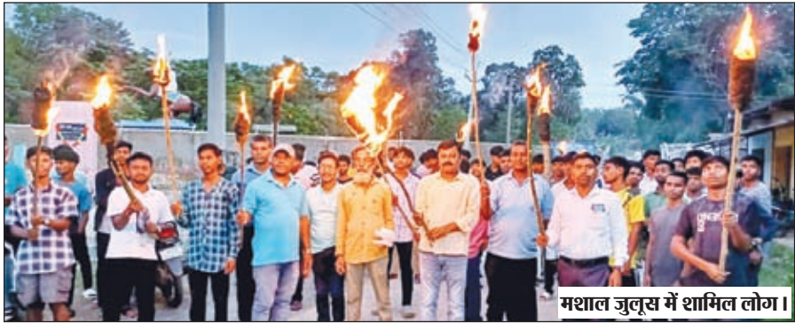
मशाल जुलूस में शामिल लोग।