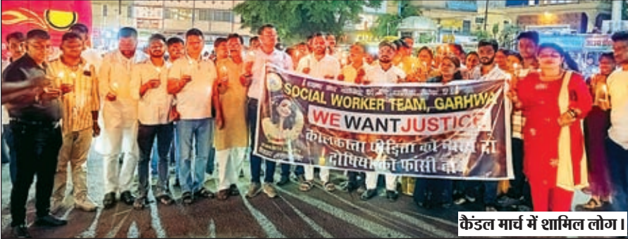
कैडल मार्च में शामिल लोग।