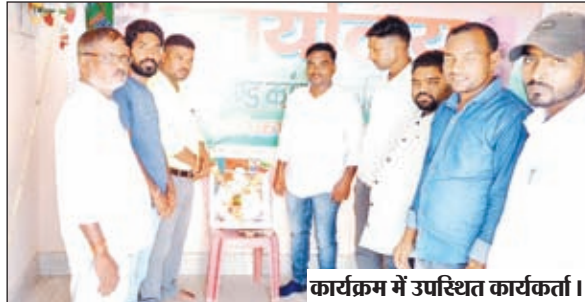
कार्यक्रम में उपस्थित कार्यकर्ता।