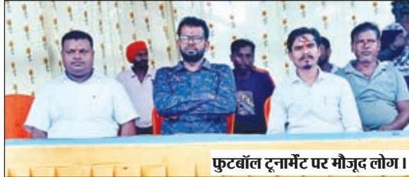
फुटबॉल टूर्नामेंट पर मौजूद लोग।