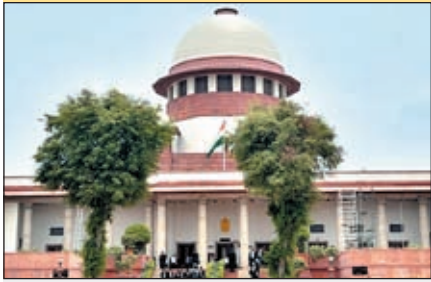
हम फिर से एक नयी घटना का इंतजार नहीं कर सकते : सुप्रीम कोर्ट