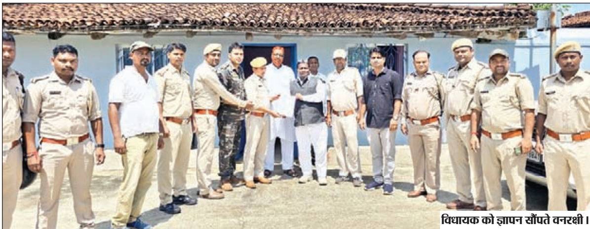
विधायक को ज्ञापन सौंपते वनरक्षी।