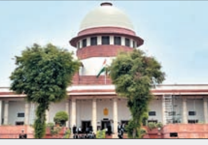
हम फिर से एक नयी घटना का इंतजार नहीं कर सकते : सुप्रीम कोर्ट

बता दें कि सर्वोच्च न्यायालय ने कोलकाता के आरजी कर मेडिकल अस्पताल में एक प्रशिक्षु महिला डॉक्टर से दुष्कर्म और हत्या के मामले में स्वतः संज्ञान लिया है।