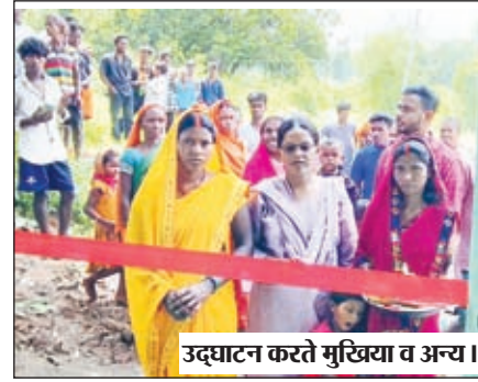
उद्घाटन करते मुख्तिया व अन्य।