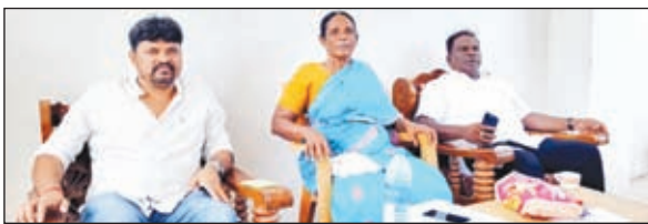
विधायक सुखराम उरांव के साथ सांसद जोबा माझी।

चक्रधरपुर। रेलवे द्वारा चक्रधरपुर के भारत भवन चौक से रेलवे स्टेशन जाने वाले मार्ग को बंद करने की योजना पर सांसद जोबा माझी और विधायक सुखराम उरांव ने कड़ा विरोध जताया है। शहरवासियों की मांग पर मंगलवार को विधायक सुखराम उरांव इसी मुद्दे को लेकर सांसद जोबा माझी से उनके आवास पर मिले। दोनों नेताओं ने मामले पर गंभीर