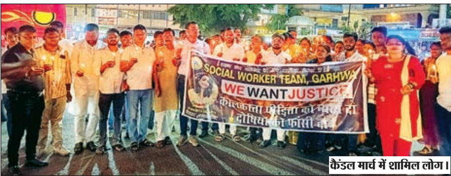
कैडल मार्च में शामिल लोग।