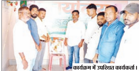
कार्यक्रम में उपस्थित कार्यकर्ता।