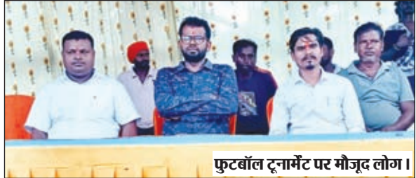
फुटबॉल टूर्नामेंट पर मौजूद लोग।