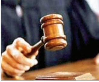
कोडरमा थाना कांड संख्या 83/2019 दर्ज किया गया था। वहीं अभियोजन का