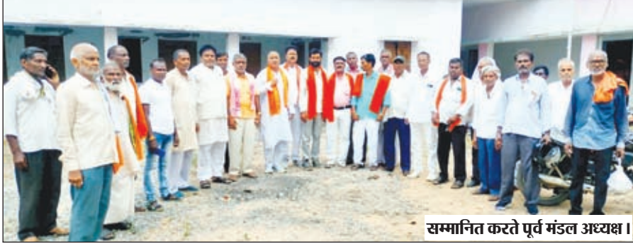
सम्मानित करते पूर्व मंडल अध्यक्ष।